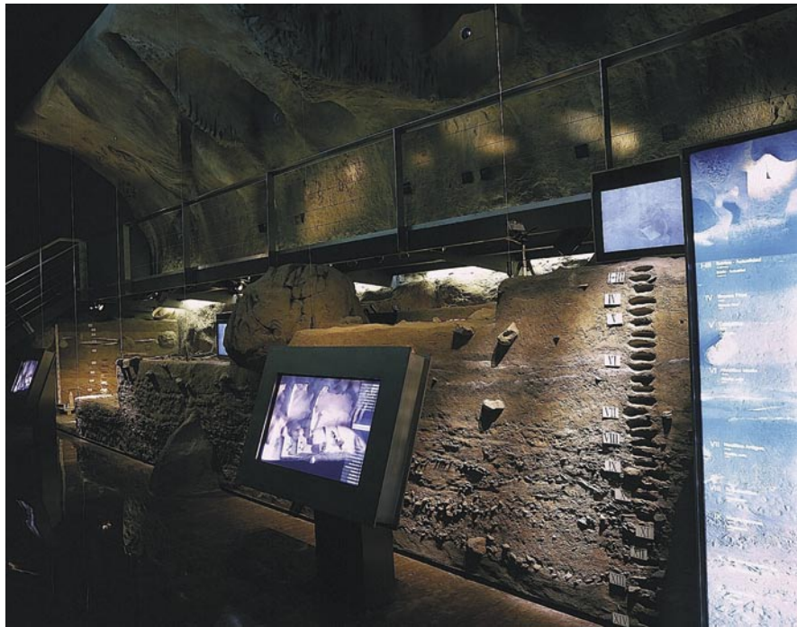
Figura 8. Escenografía de la Sala de Arqueología de Campo.

de profesionales de distintos campos de la ciencia-, de todos los registros documentales que maneja la arqueología, desde los meros objetos hasta los documentos ambientales, pasando por los epigráficos y geográficos, permite la reinterpretación y reconstrucción de la evolución y transformación de nuestro paisaje, de nuestras ciudades o de cómo se produjo la interculturalidad facilitada por nuestra condición de territorio mediterráneo.