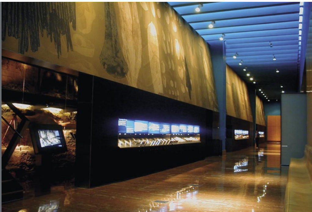
Figura 1. MARQ. Espacio comunicador y vertebrador de las Salas Permanentes.

de basar la museología emergente, acorde con los nuevos tiempos del nuevo siglo.