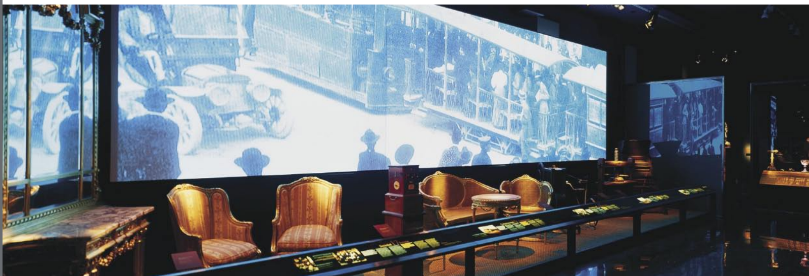
Figura 6. Audiovisual con documentación histórica y gráfica de la Sala de Edad Moderna y Contemporánea.