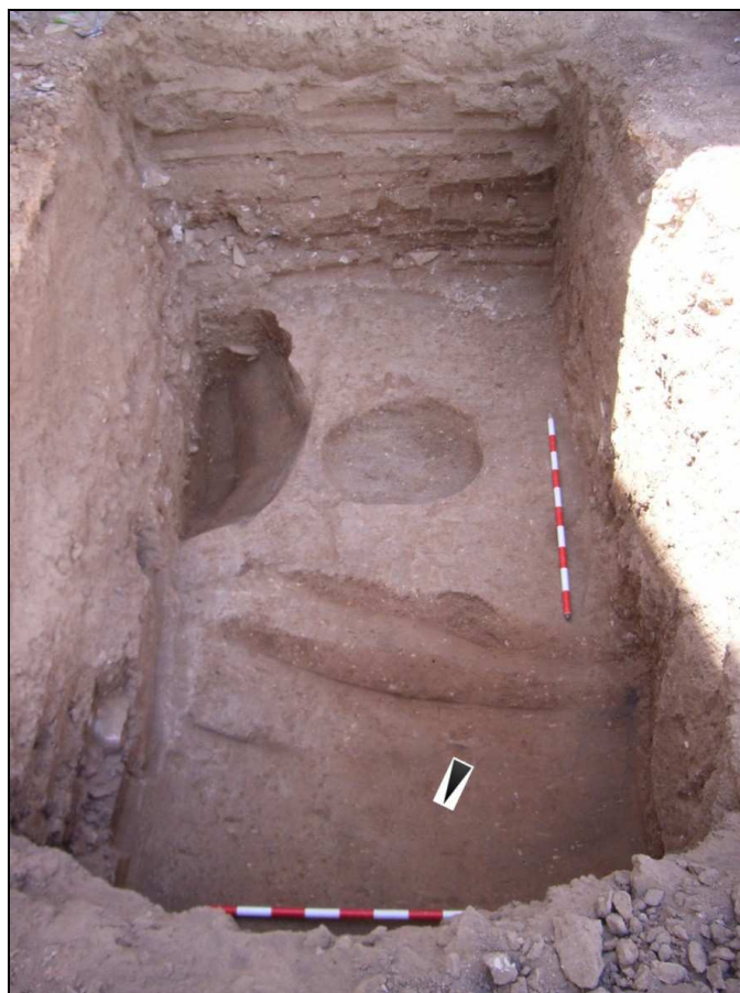
Vista del sondeo 1 una vez finalizado.