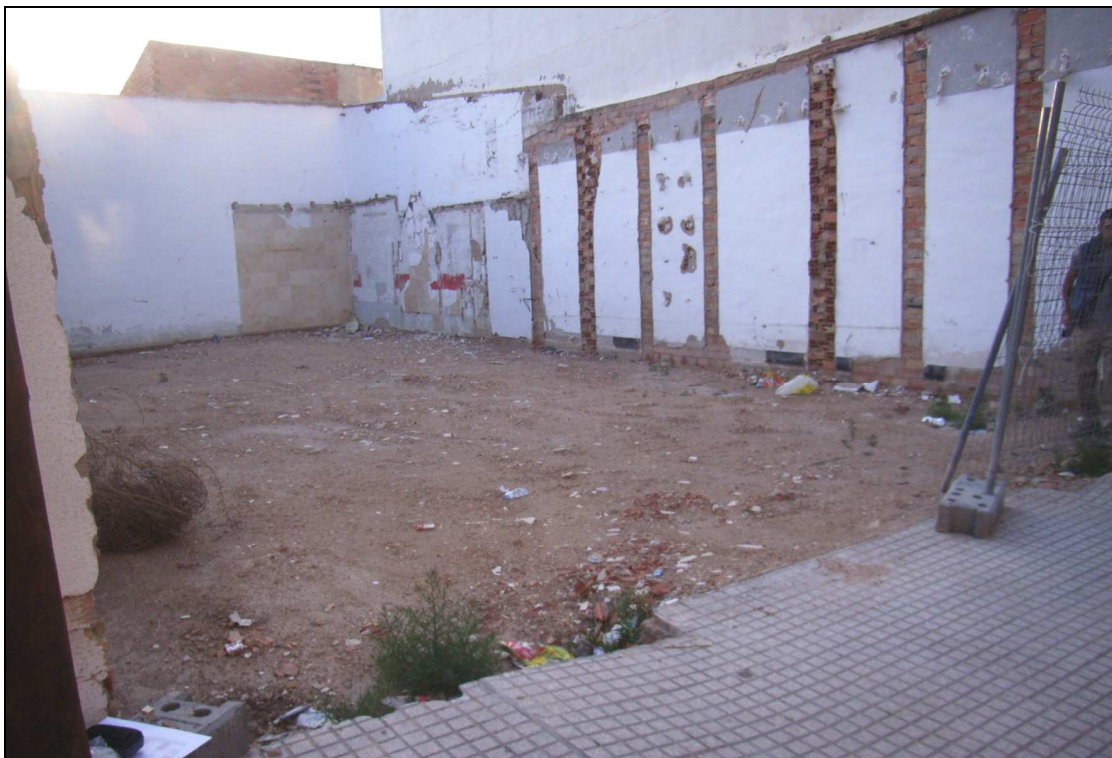
Vista del solar antes de comenzar la intervención.