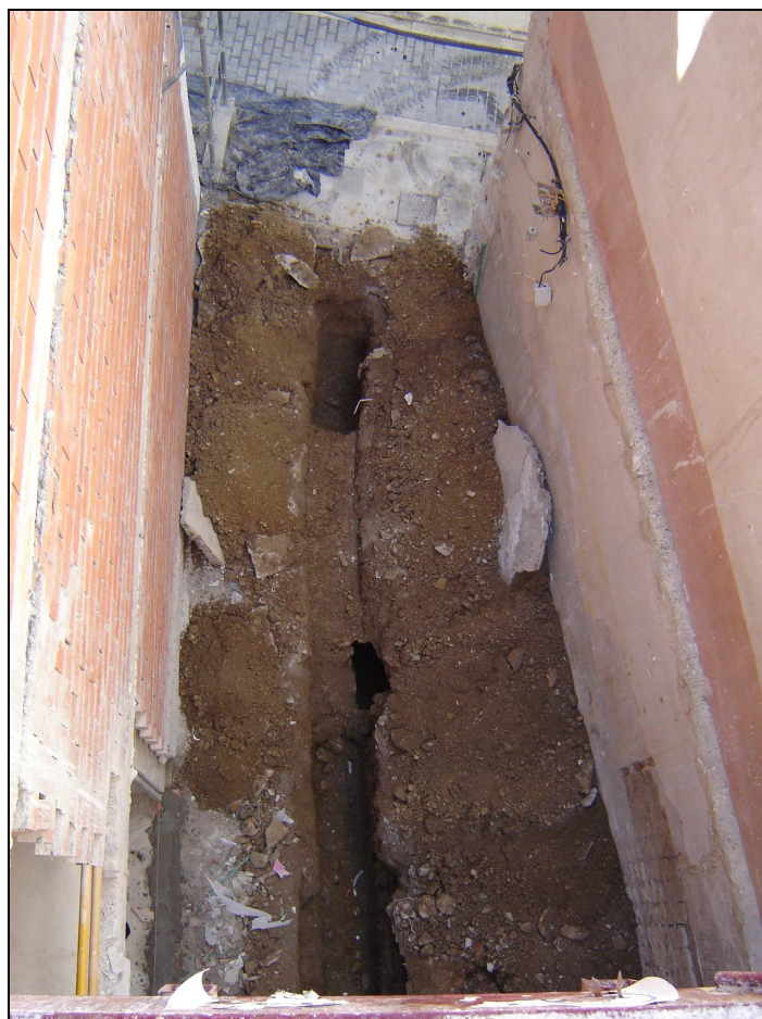
Vista desde el norte del sondeo de la calle San Agustín, 1.