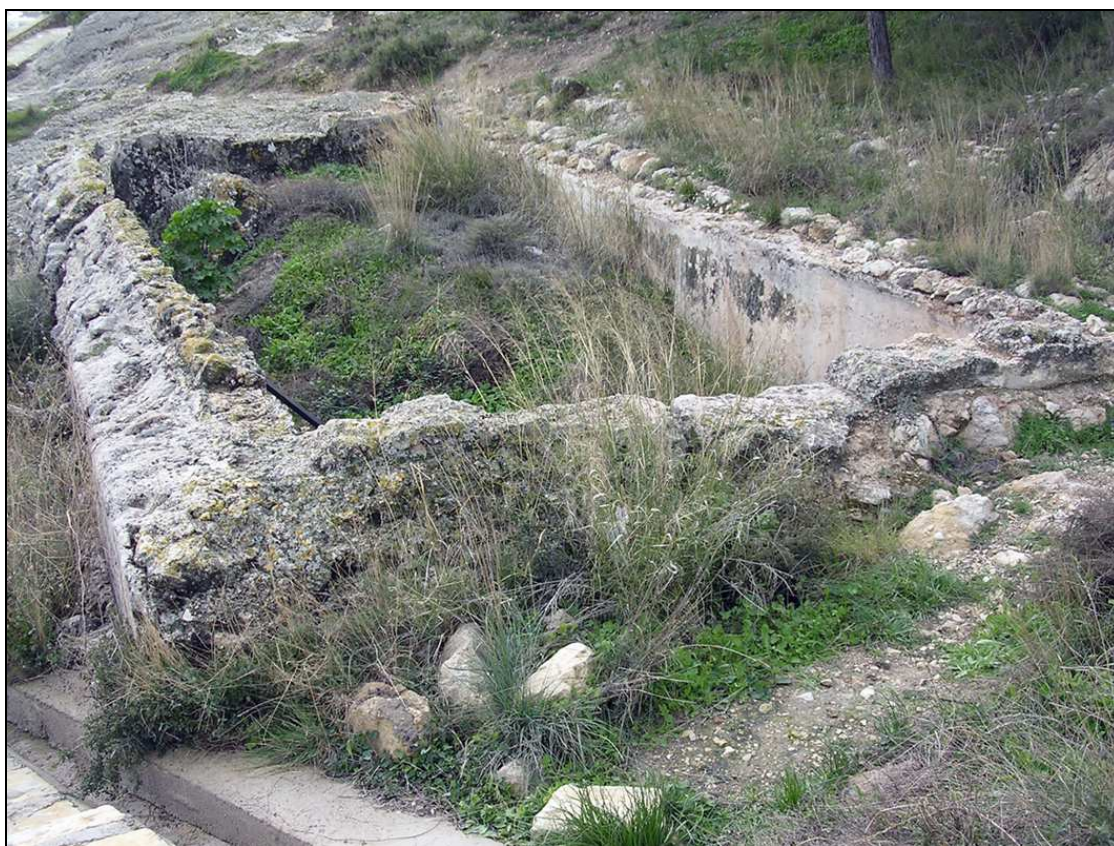
Vista del aljibe antes de iniciar la excavación arqueológica.