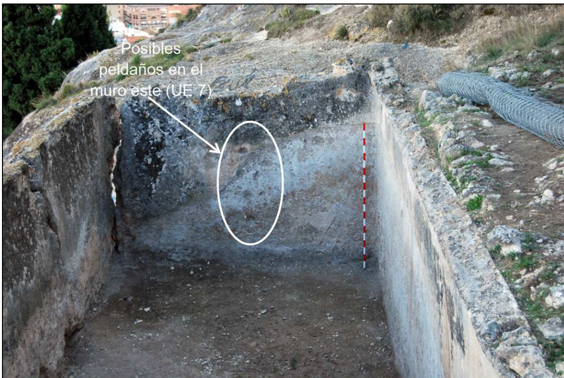
Vista del muro sur del aljibe con los posibles peldaños.