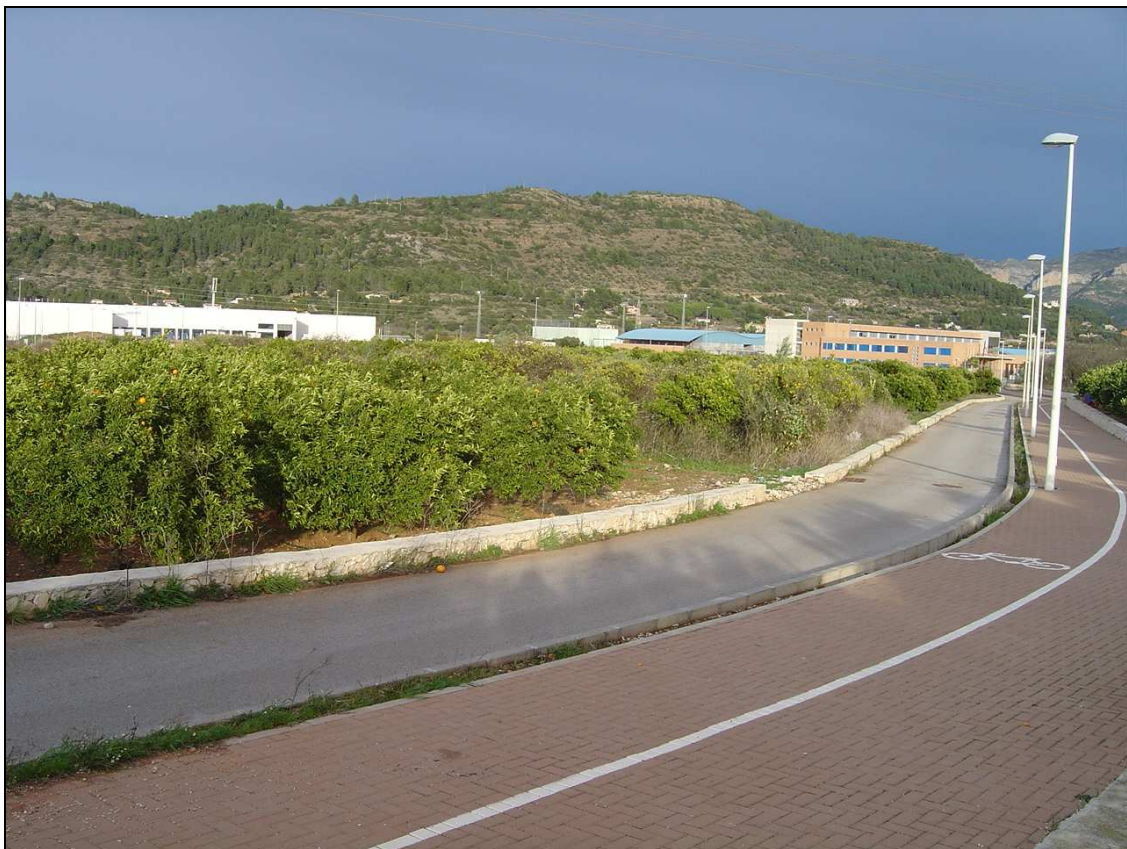
Cara sud de les parcel·les 154 en primer pla, 35 al mig i 37 al fons, vora el carrer de l'Institut.