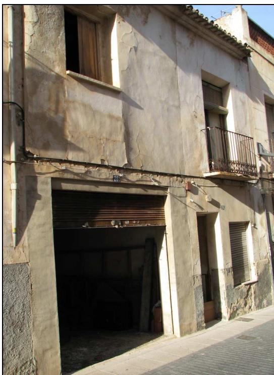
Fachada de la vivienda sondeada.