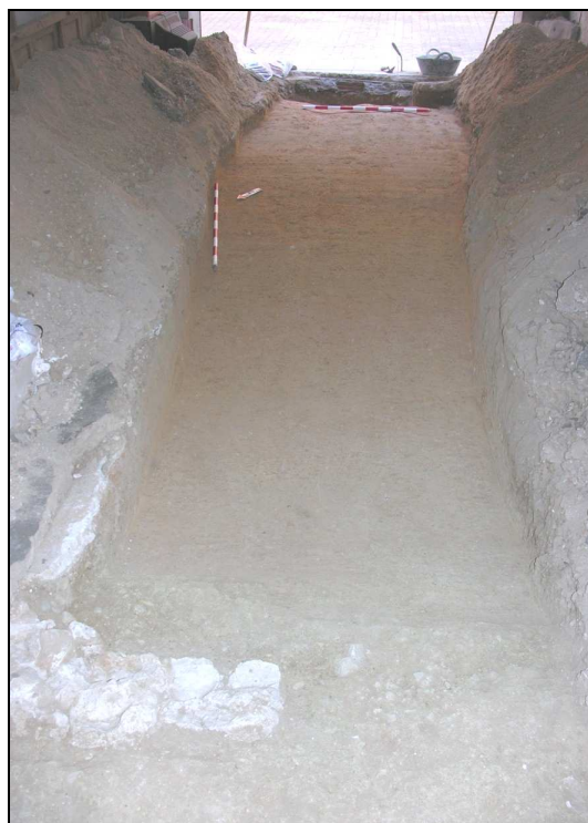
Vista del sondeo 2 una vez finalizado.