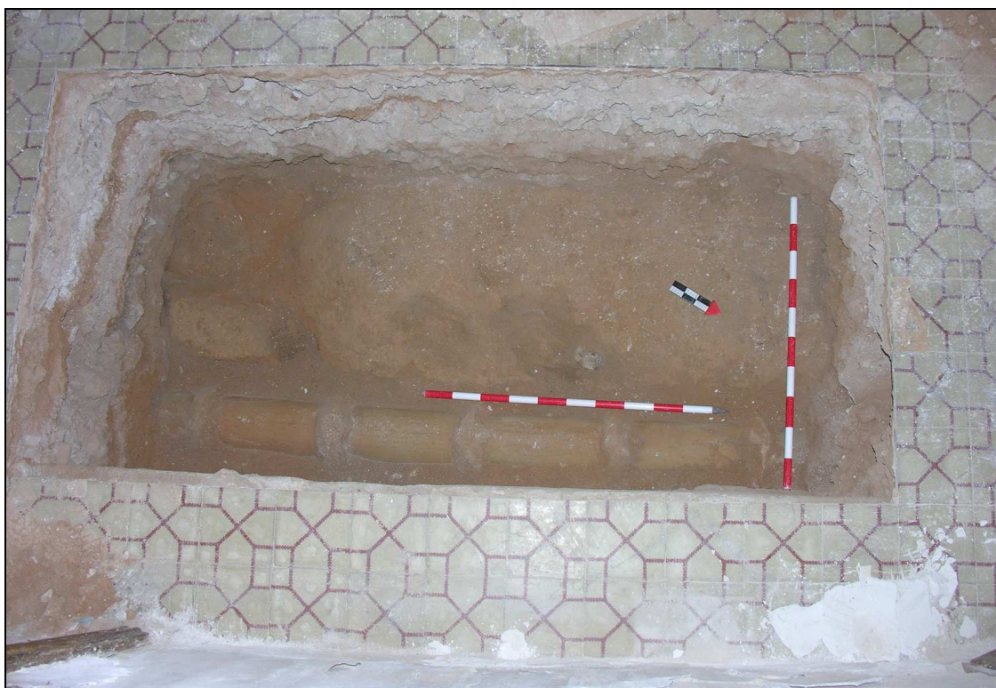
Vista del sondeo 1 una vez finalizado.