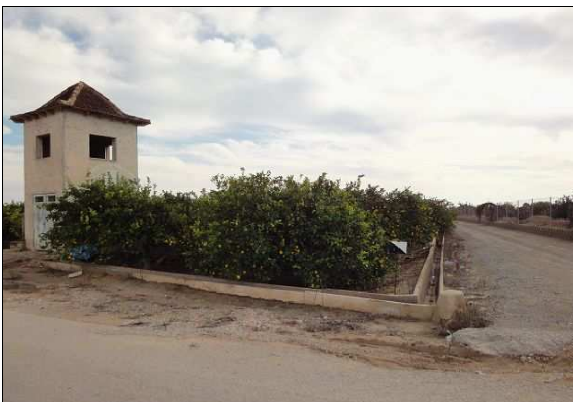
Ámbito de instalación del apoyo 24 y Colada de la ermita del Carmen.