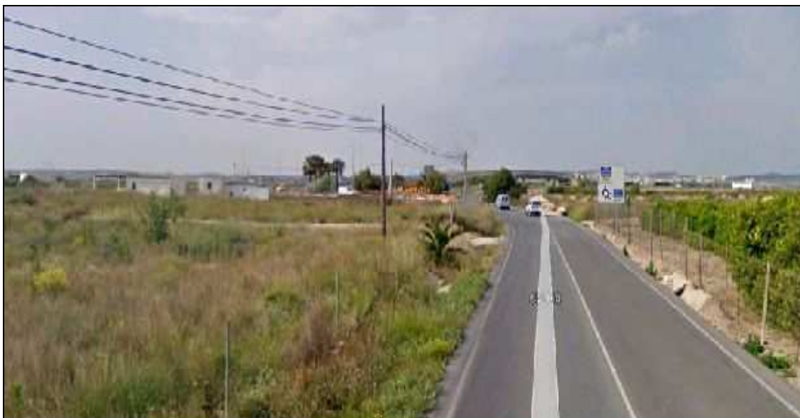
Estado actual de la Vía Augusta.