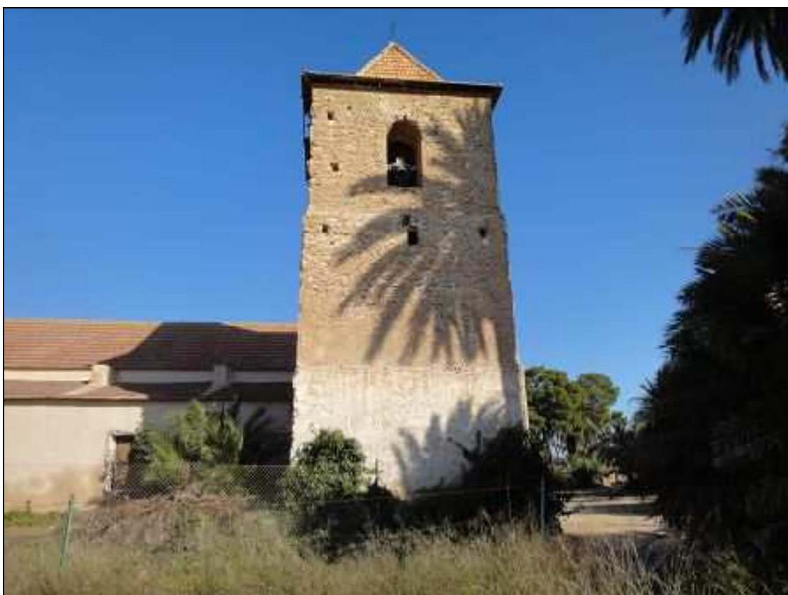
Vista de La Marquesa y de la torre campanario desde el ámbito de instalación del apoyo 3.