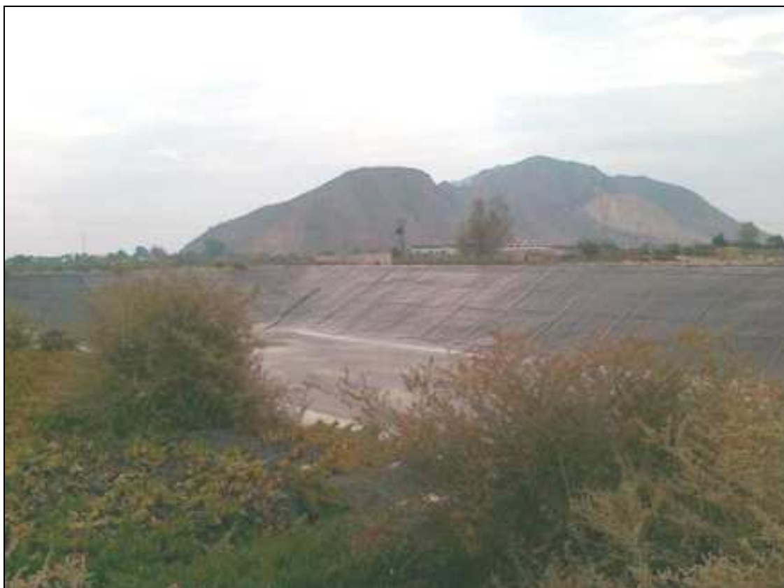
Vista de la gran balsa ubicada en la zona media de la parcela.