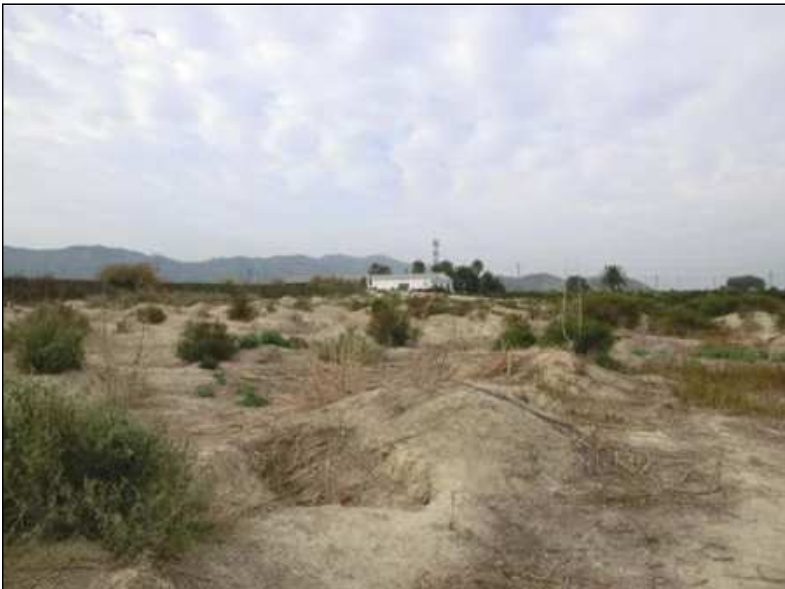
Vista de los hoyos dejados tras el arranque de los limoneros.