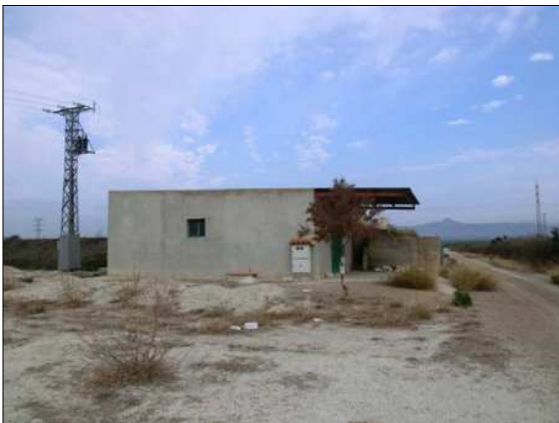
Vista de la caseta agrícola junto a la gran balsa.