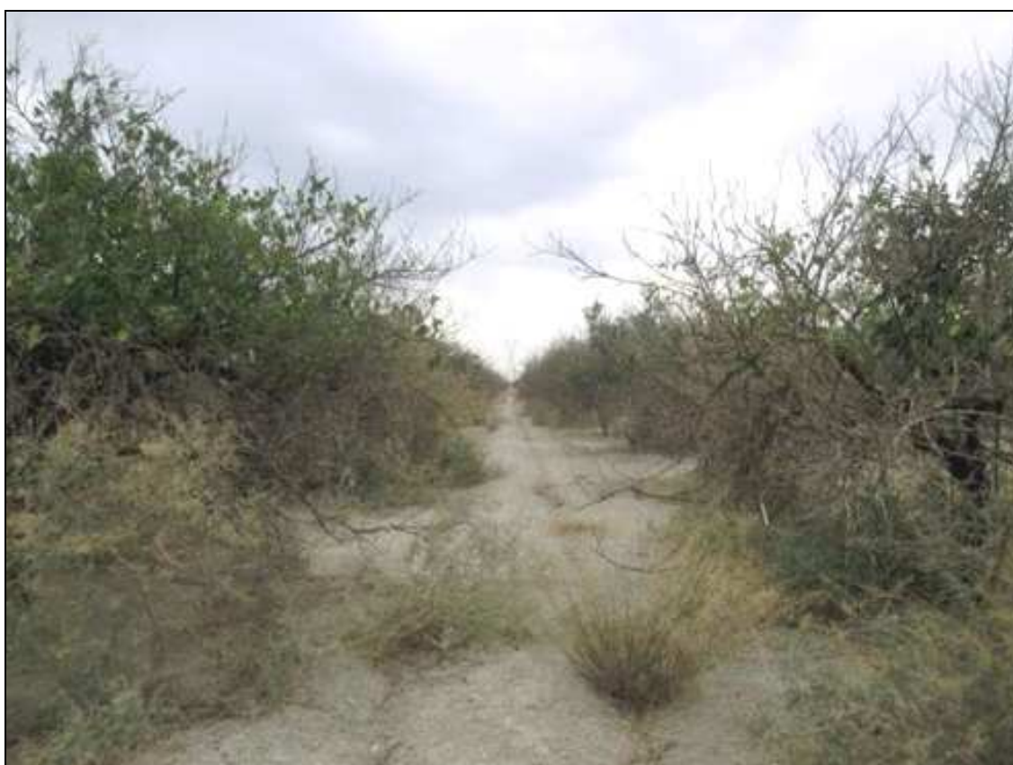
Vista de la zona media del área de estudio, con limoneros abandonados.