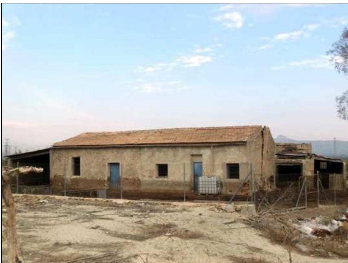
Vista de la casa de campo de los años 40-50 del siglo XX, con cobertizos y patios anexos.