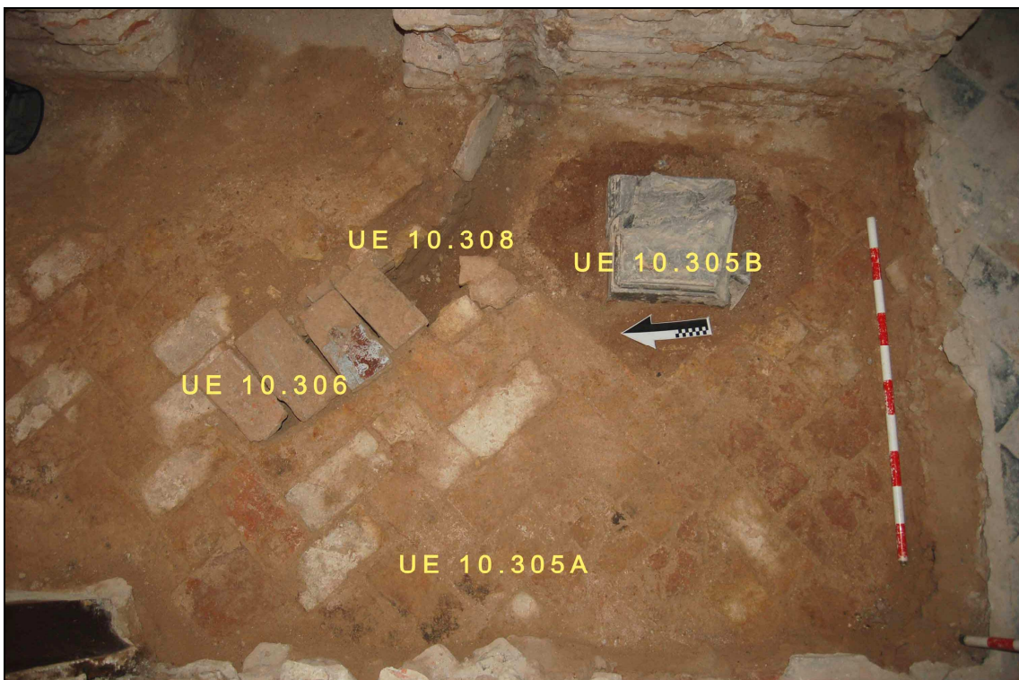
Detall de la intervenció amb les unitats estratigràfiques documentades.