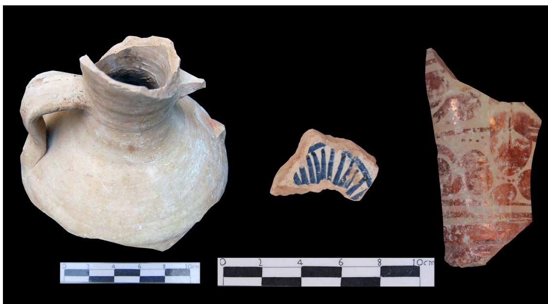
Ceràmiques recuperades en la intervenció.