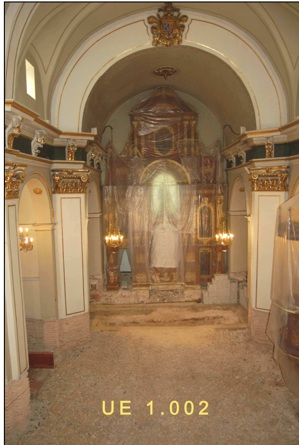
Vista de l'interior de l'església.