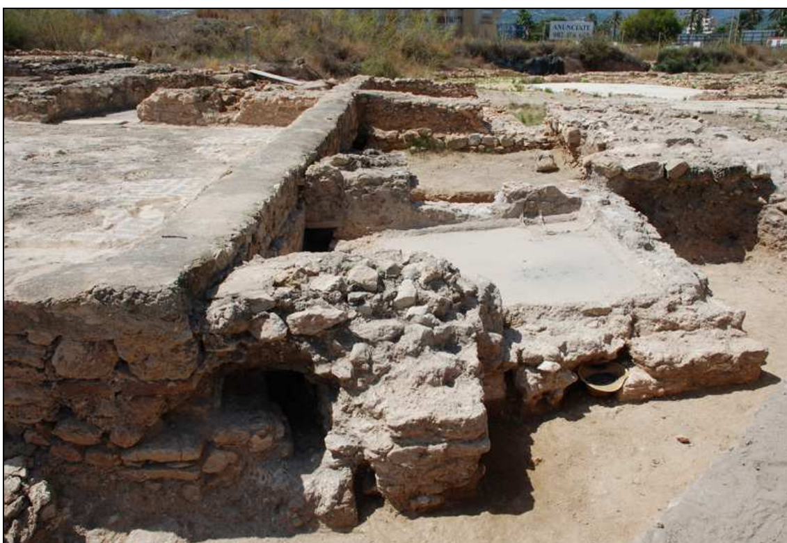
Vista de la habitación 2 y de la balsa descubierta durante esta campaña.