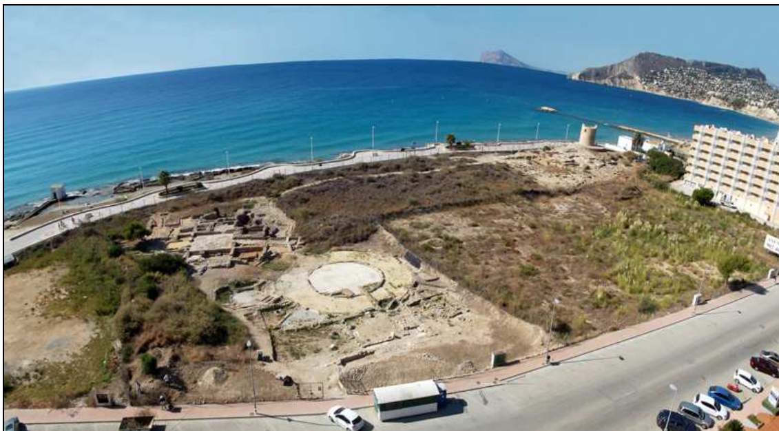
Aspecto del enclave arqueológico de Baños de la Reina al finalizar los trabajos.