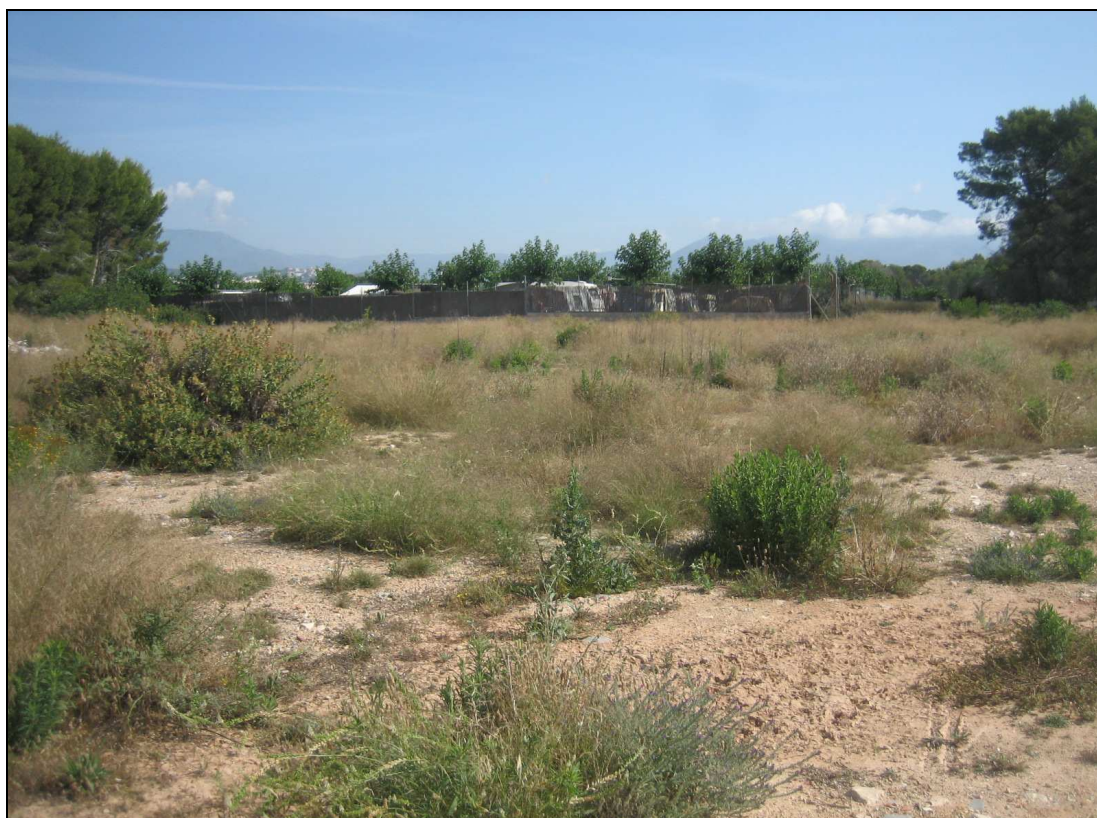
Vista parcial del área de intervención.