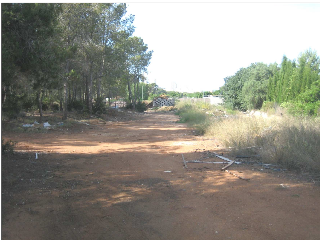
Vista parcial del área de intervención.