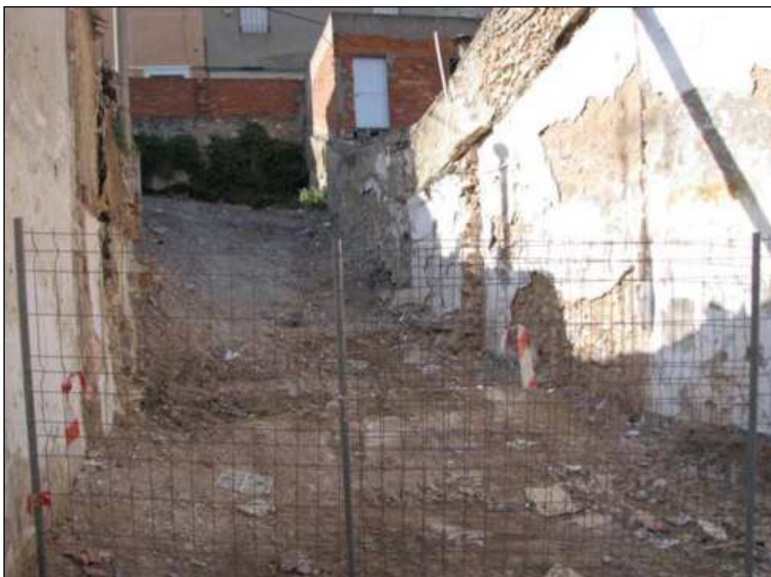
Vista del solar tras la demolición y el desescombro de la vivienda.