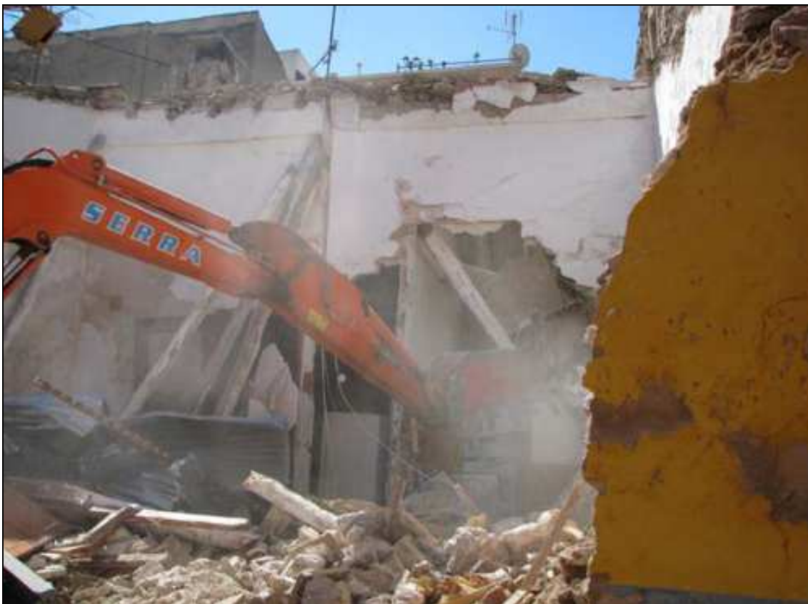
Vista de la zona media de la demolición, con los tabiques centrales de ladrillo macizo.