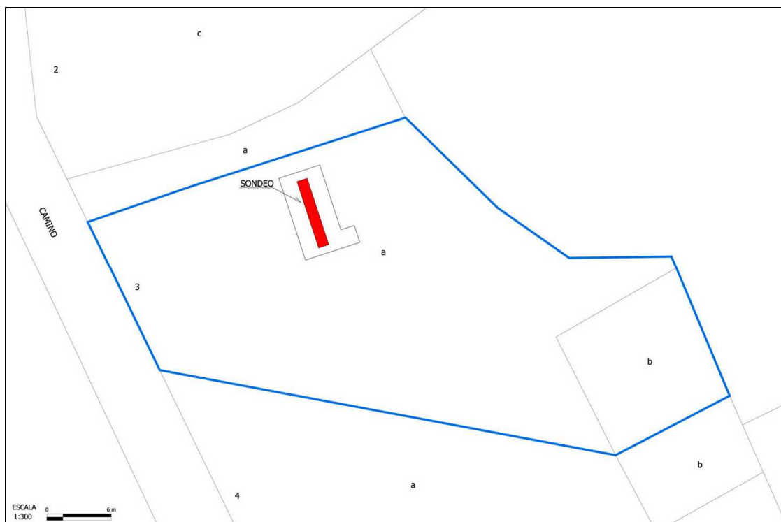
Plano de situación del área de intervención.