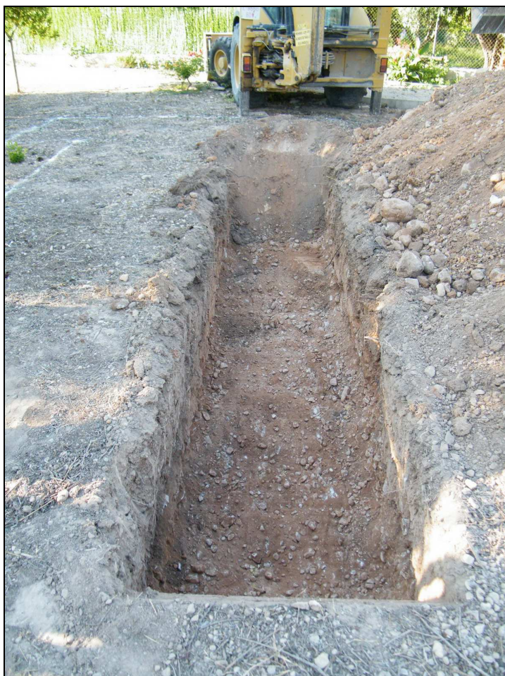
Vista del sondeo realizado.