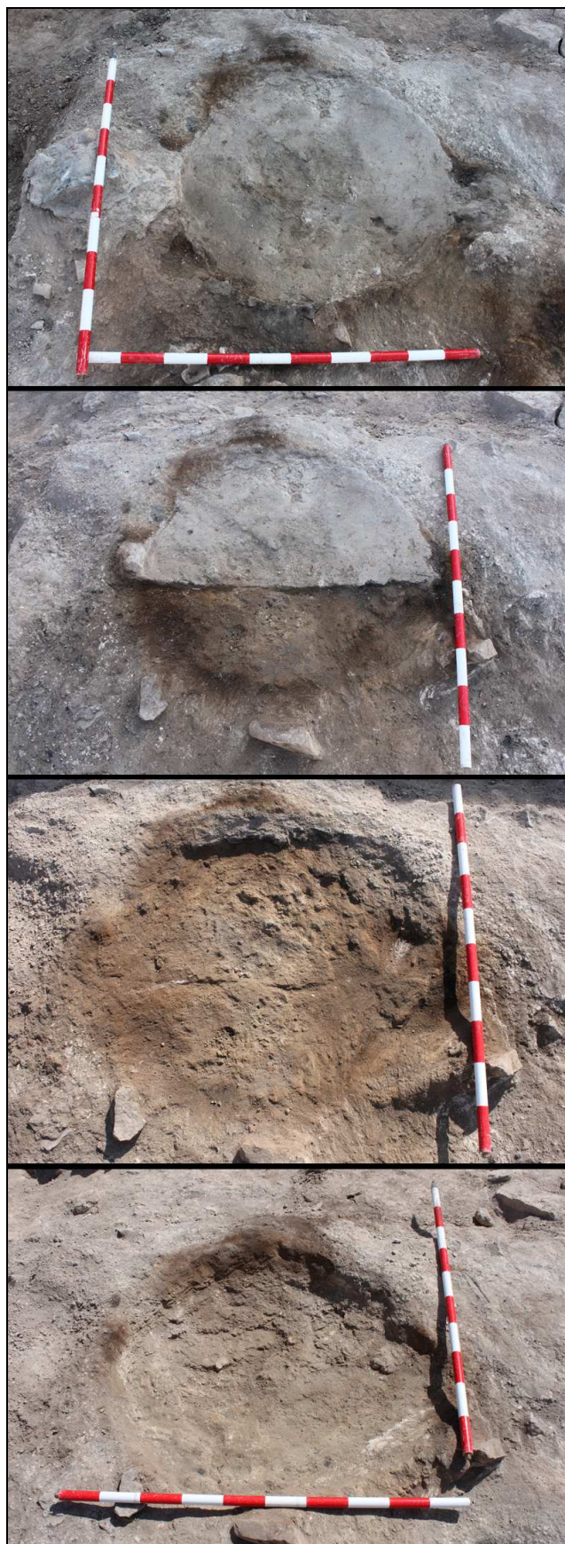
Proceso de excavación de la UE 11560: tortera documentada en el “espacio abierto”.