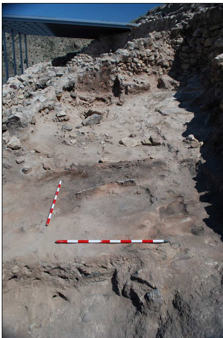
Tortera documentada en la fase antigua del departamento XXIX.