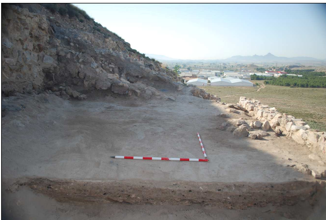
Departamento XXVIII (corte 8) a la finalización de la excavación.