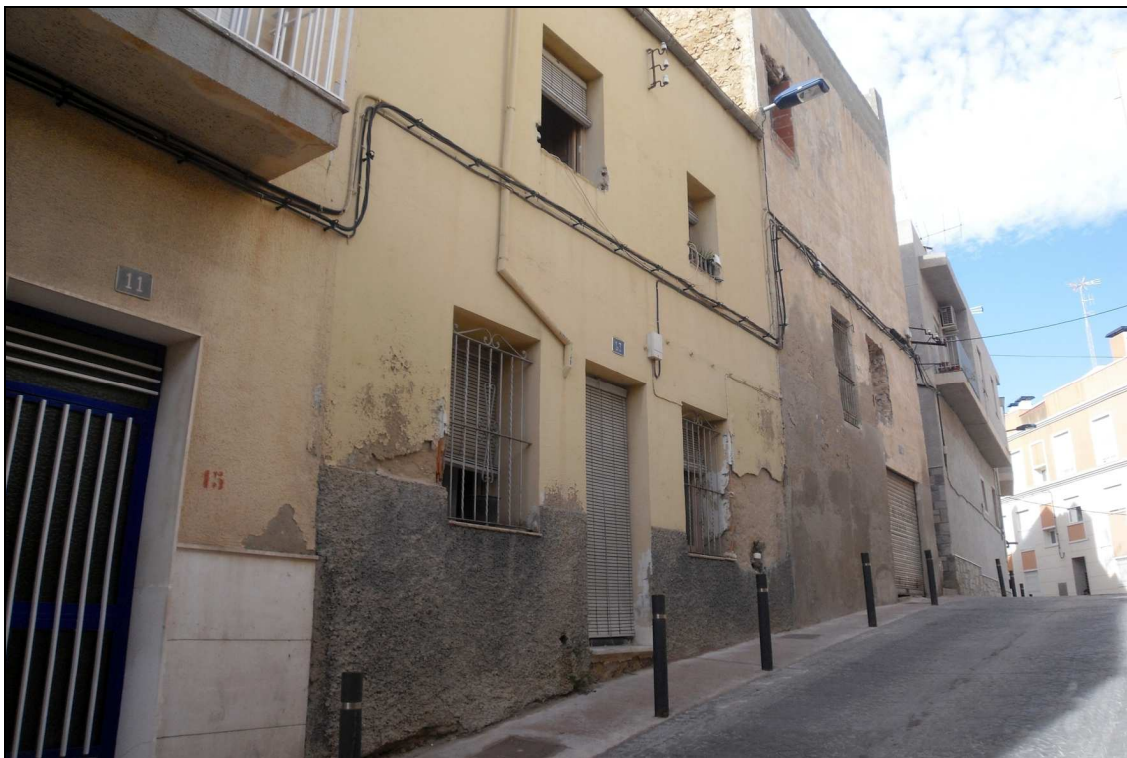
Vista de la fachada de la vivienda donde se realizaron los sondeos.