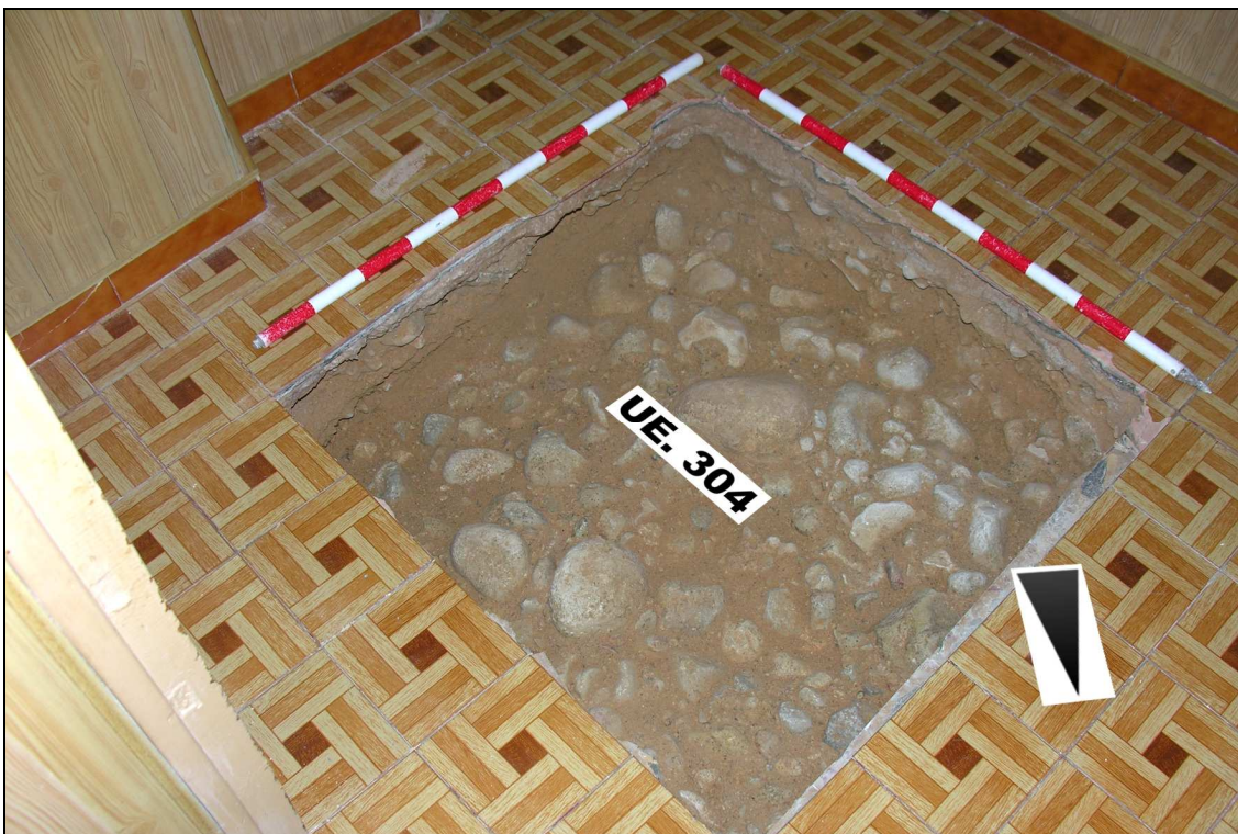
Vista del sondeo 3 una vez terminados los trabajos arqueológicos.