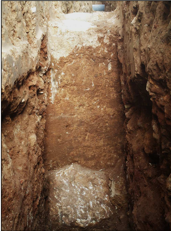
Detall de la muralla oriental de la medina de Daniya (segle XI).