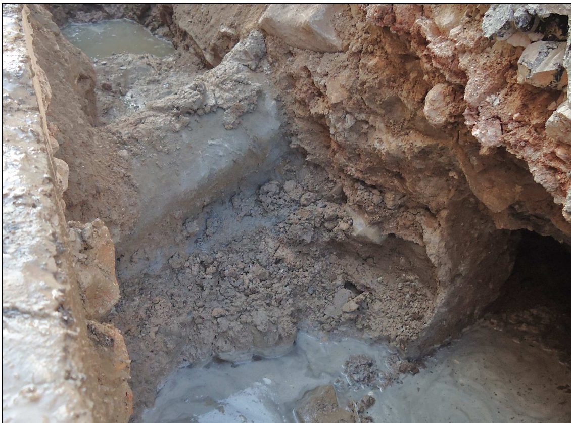
Detall de la muralla oriental almohade de la medina de Daniya (segle XII).