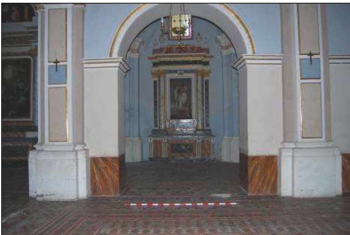
Detalle del área de actuación, epístola.