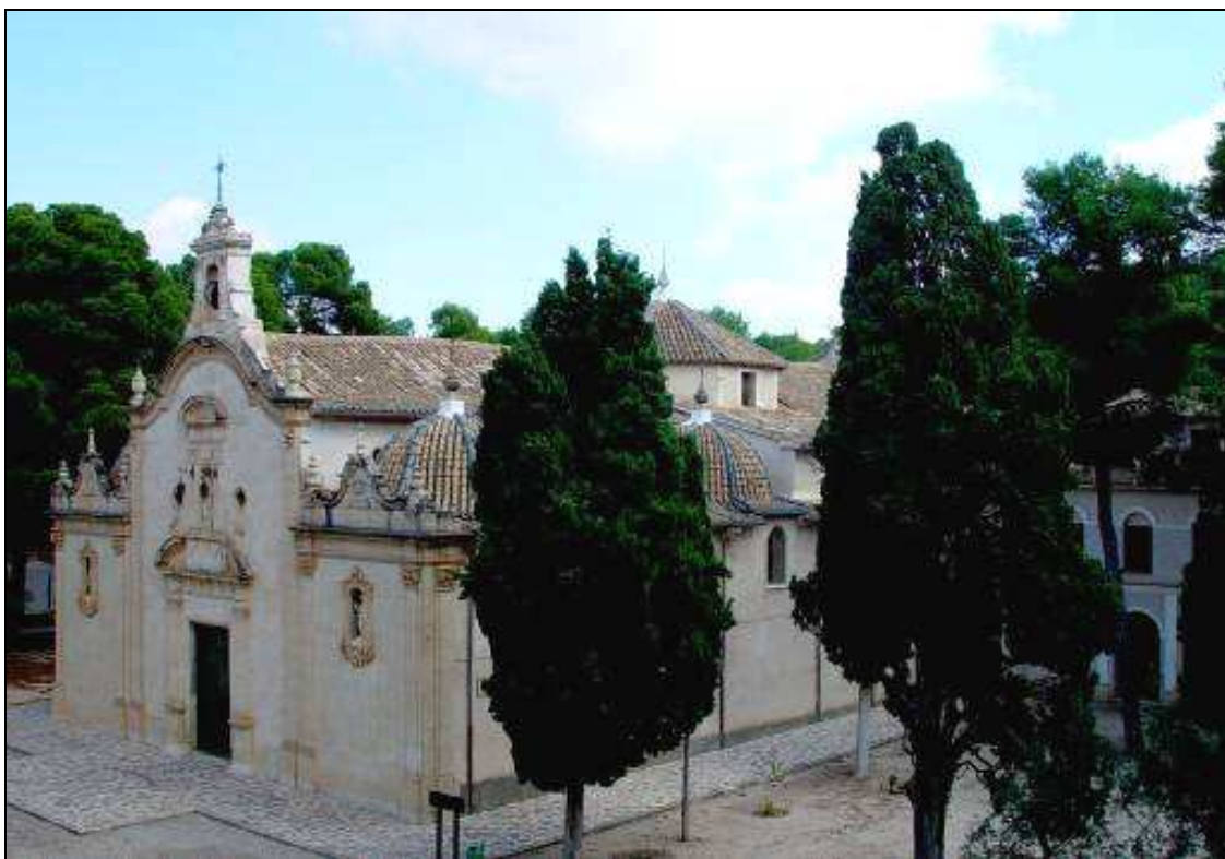
Panorámica del santuario Virgen de Gracia.