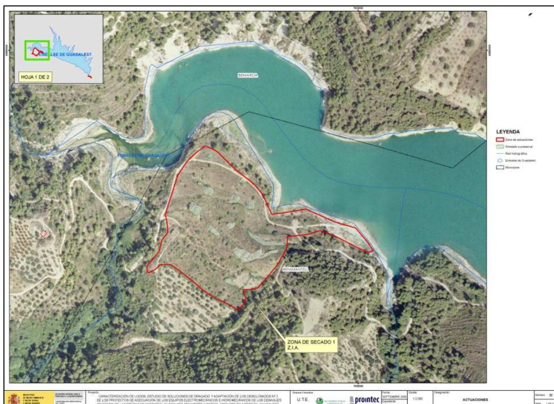
Vista aérea del área de actuación nº 1.