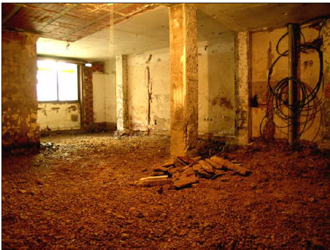
Vista del interior del inmueble al concluir la intervención.