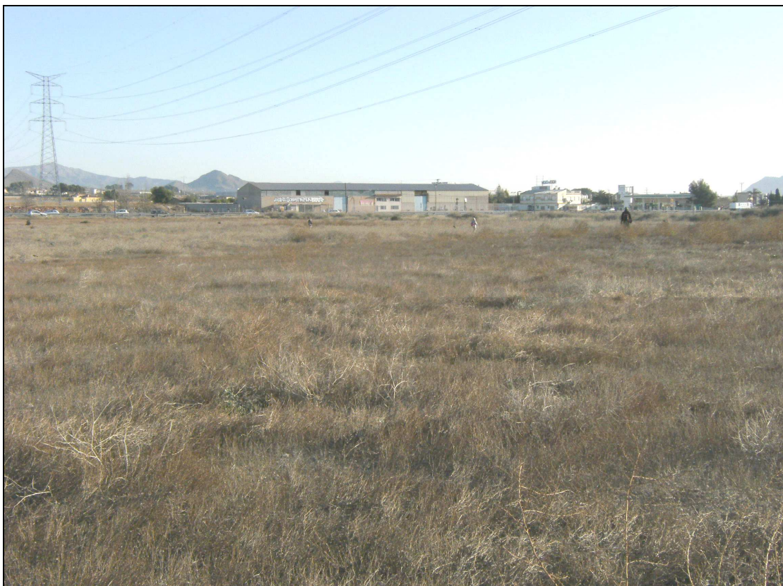
Vista parcial del área de intervención.