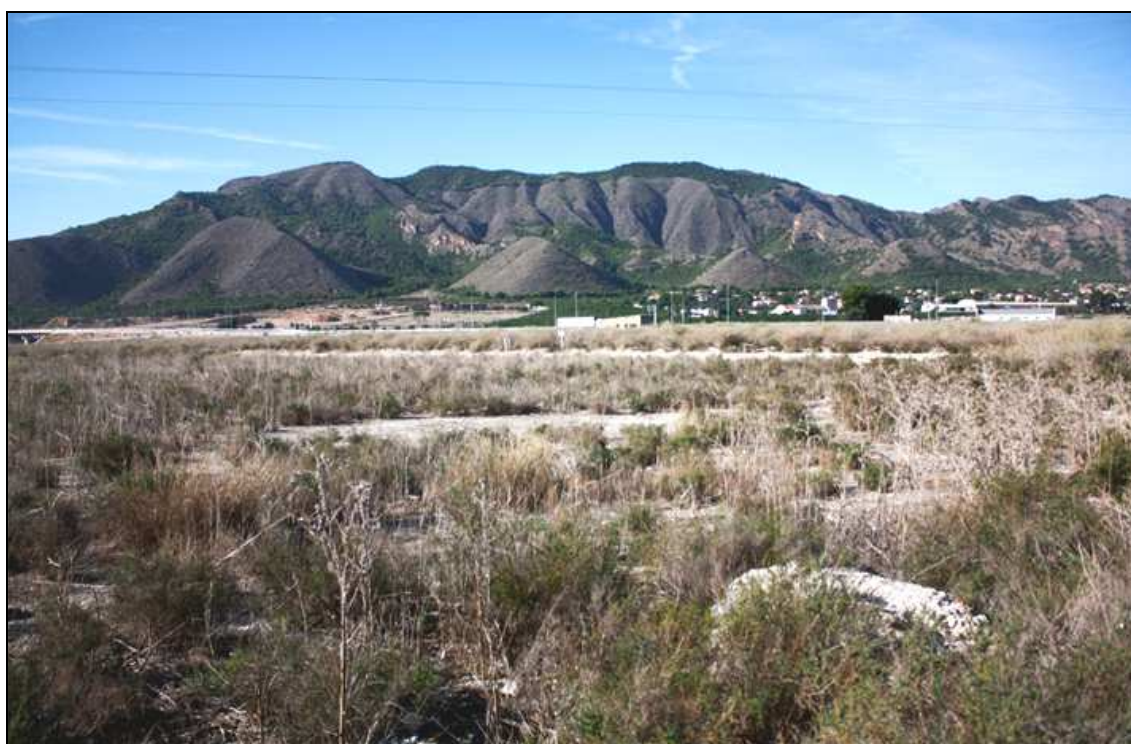
Panorámica del área de estudio, con la sierra de Orihuela al fondo.