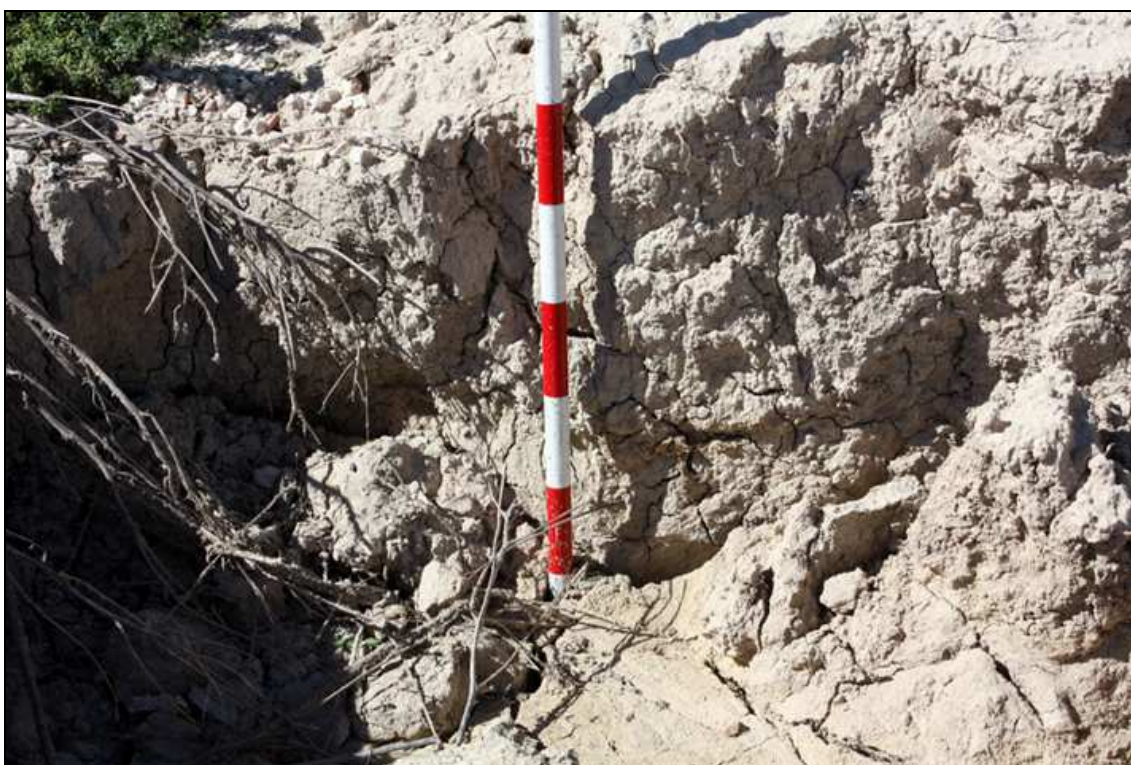
Detalle de perfil estratigráfico en sondeo.