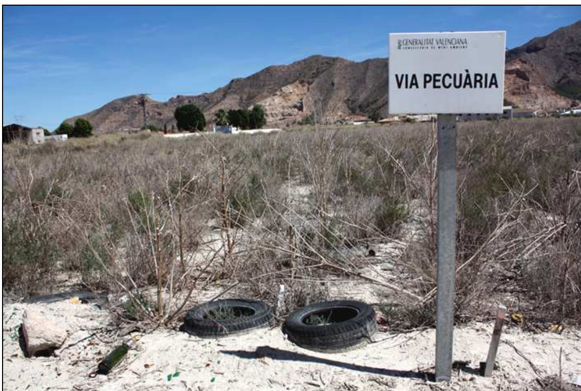
Vía pecuaria, con la sierra de Callosa al fondo.