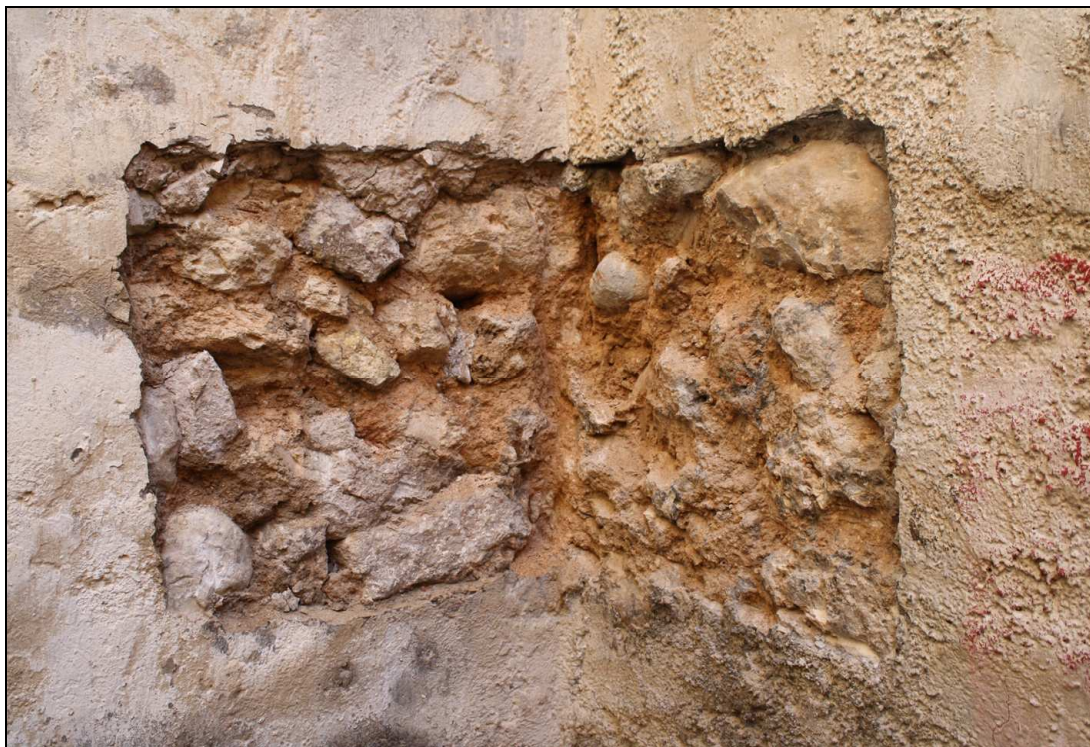
Alzados de mampostería en el ángulo exterior de las plantas inferiores de Sant Mateu, 104.