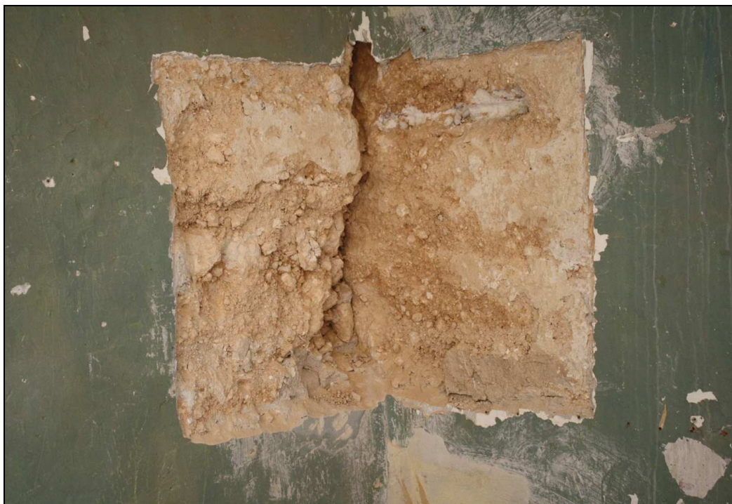
Ángulo de encuentro entre cajonadas de tapial en Sant Mateu, 104.