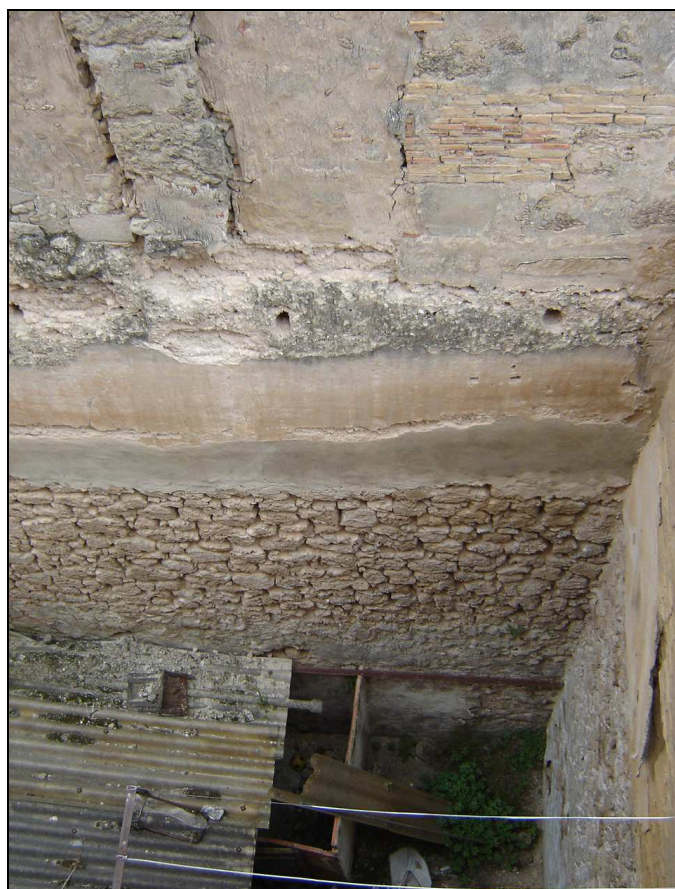
Superposición de tapiales sobre el muro de contención de mampostería que forma el patio de Sant Mateu, 104.