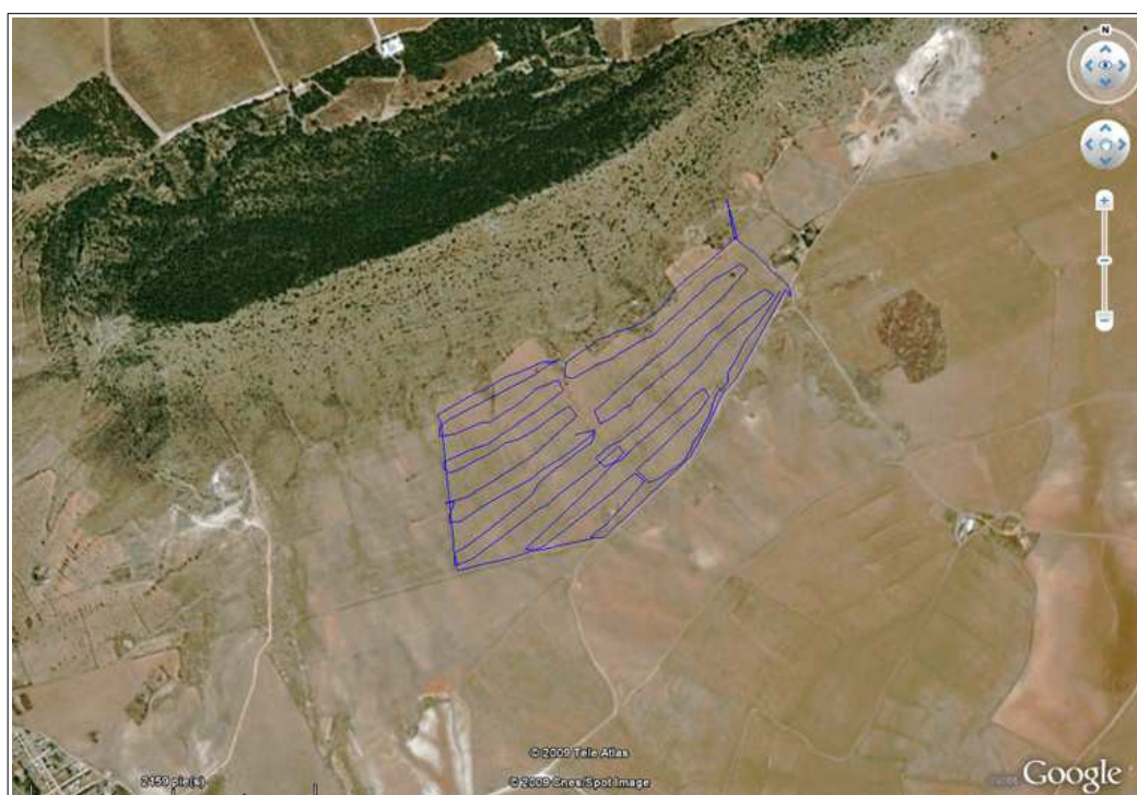
Traza del track del GPS sobre ortofoto