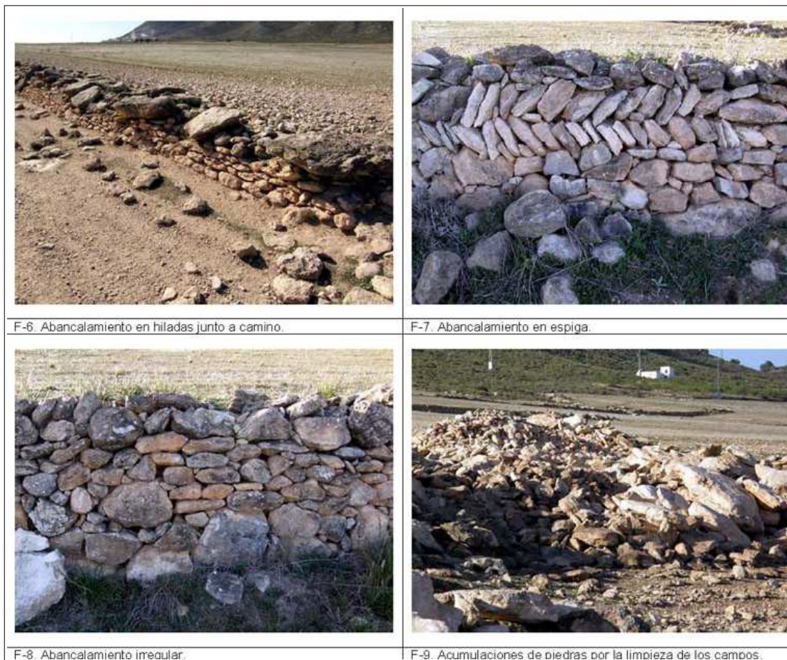
Fotografías de abancalamientos de la zona prospectada