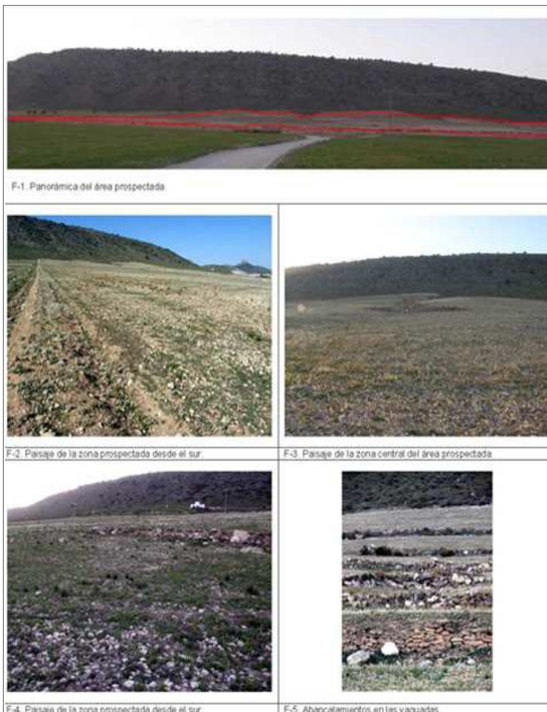
Fotografías de los paisajes de la zona prospectada