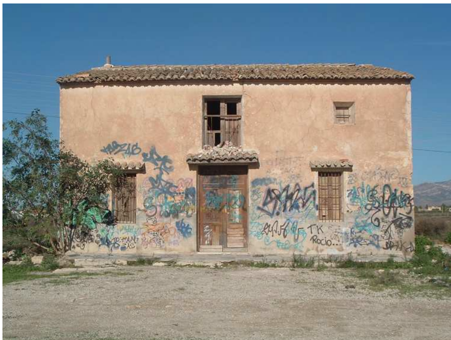
Elemento etnográfico 1 (ETN-01)