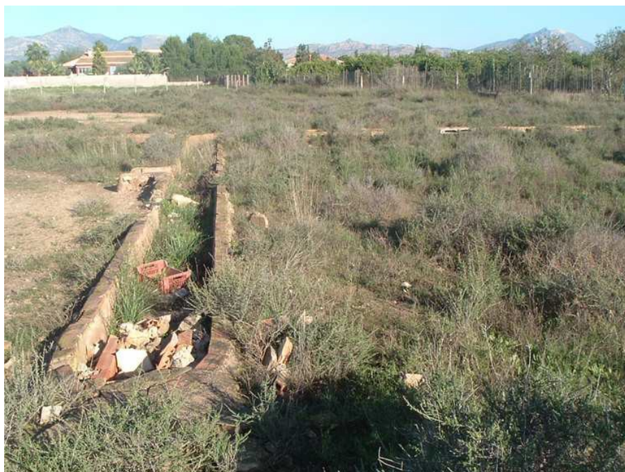
Elemento etnográfico 8 (ETN-08)