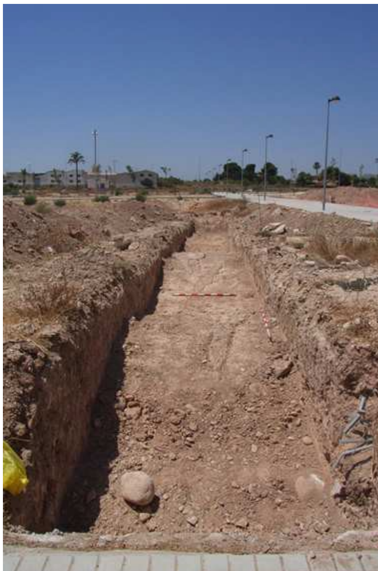
Vista del sondeo en la parcela M4