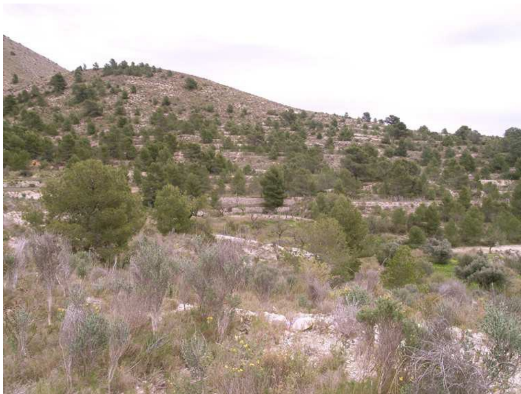
Vista parcial del área de prospección