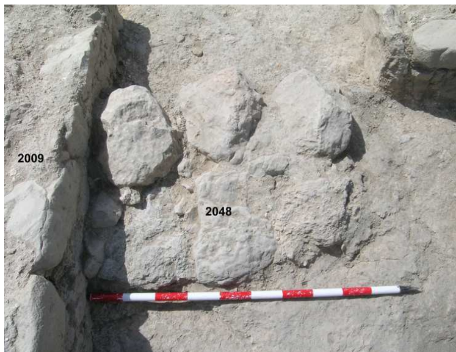
Detalle de las escaleras de acceso a la habitación de servicio del hipocausto