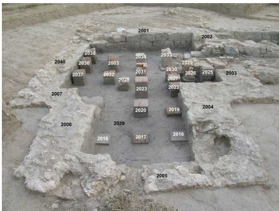
Vista del hipocausto