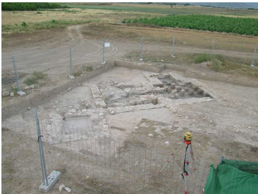
Vista general del área de excavación