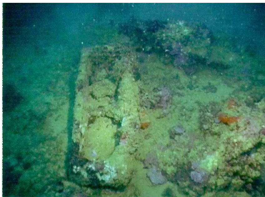
Vista del zuncho sumergido