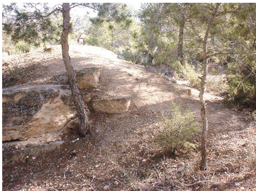
Vista de El Ciscar