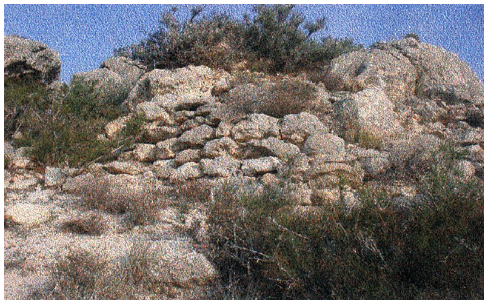
Vista de las estructuras conservadas en el Morret del Moro