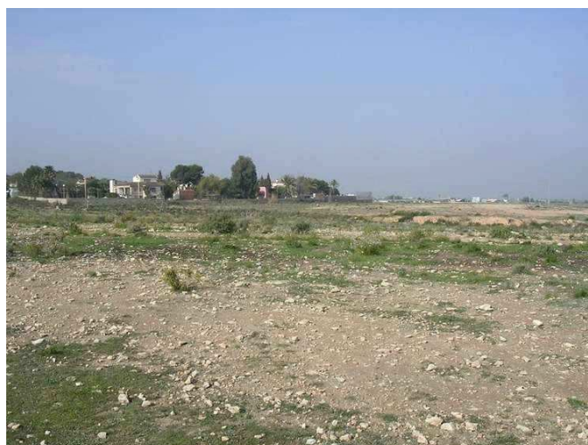
Vista general del Sector M-12