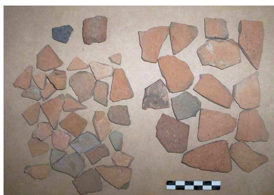
Conjunto cerámico recuperado