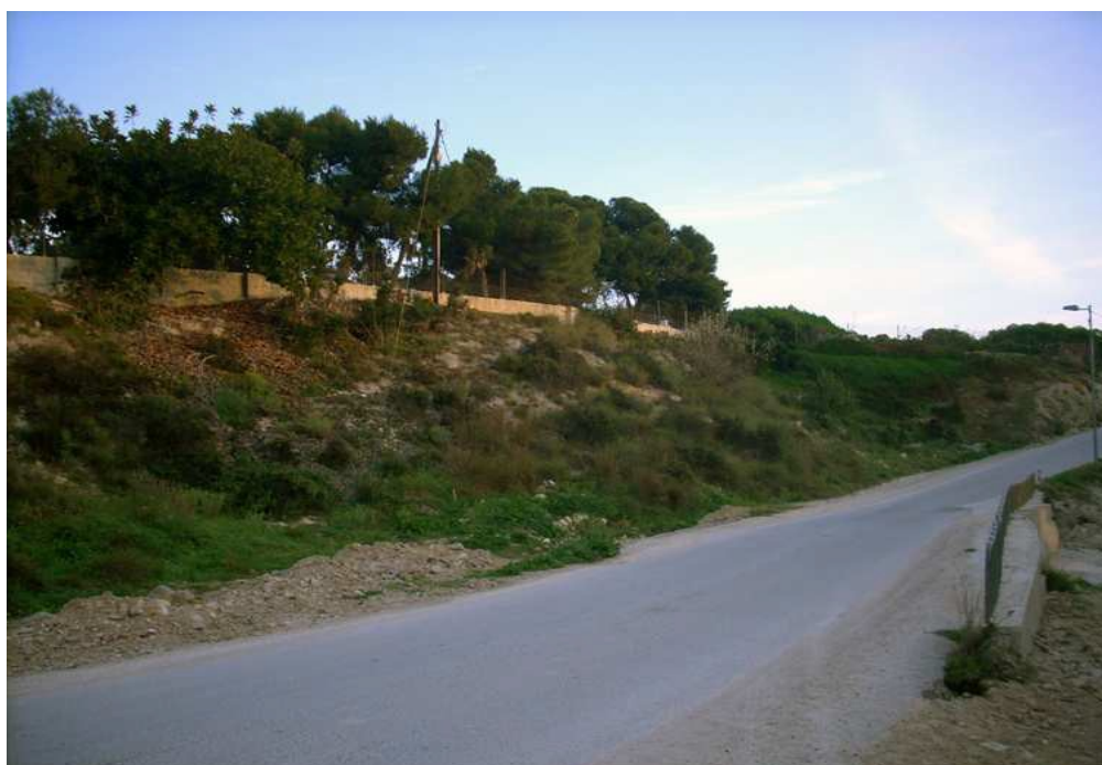
Vista parcial del área de intervención