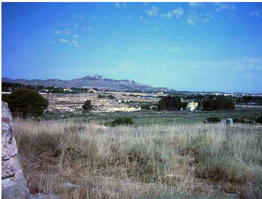
Vista del término de Sax desde El Chorrillo