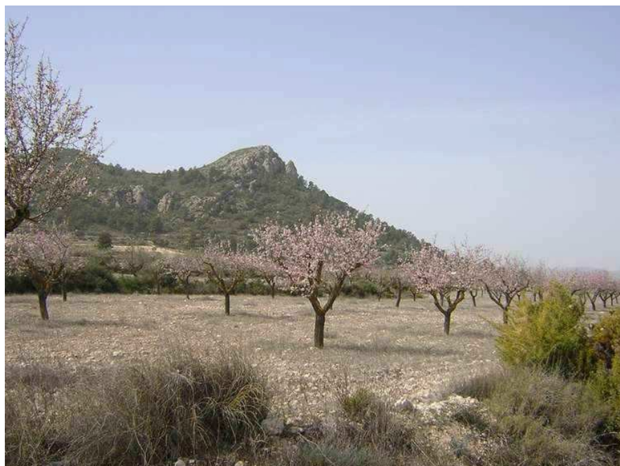
Yacimiento Peñón del Rey