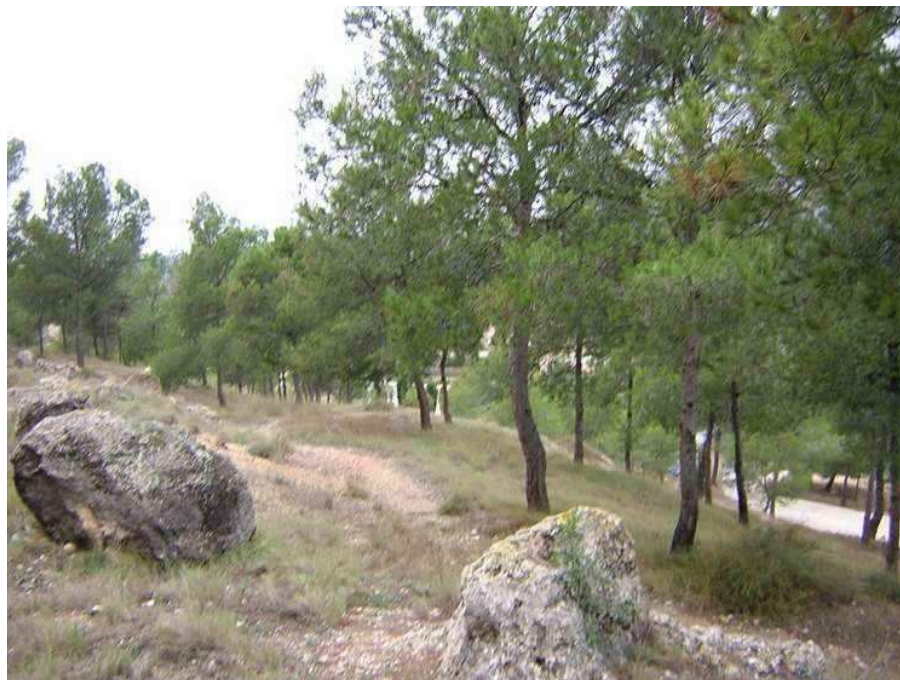
Yacimiento Peña del Castillo