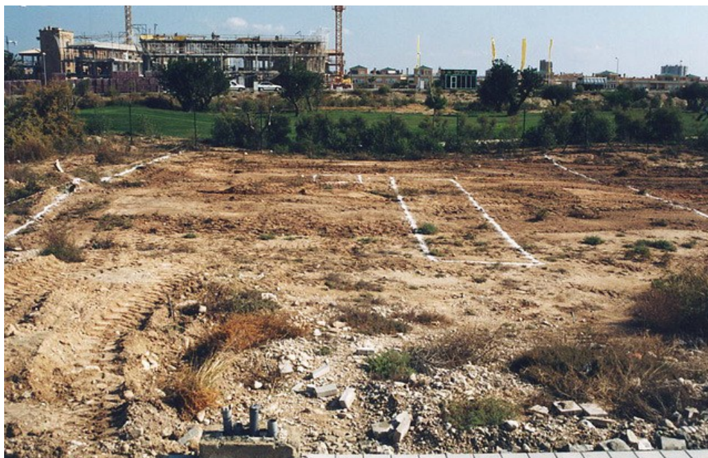
Vista general de la parcela