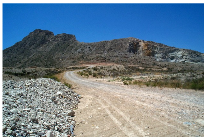
Vista panorámica del paraje desde otro ángulo