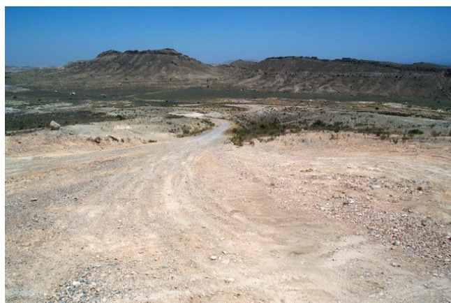
Vista panorámica del paraje