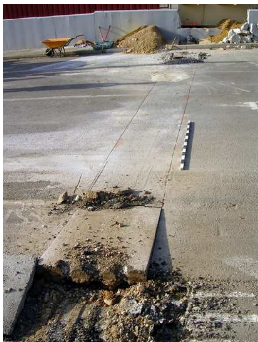
Rasa Serelles (NE-SO)