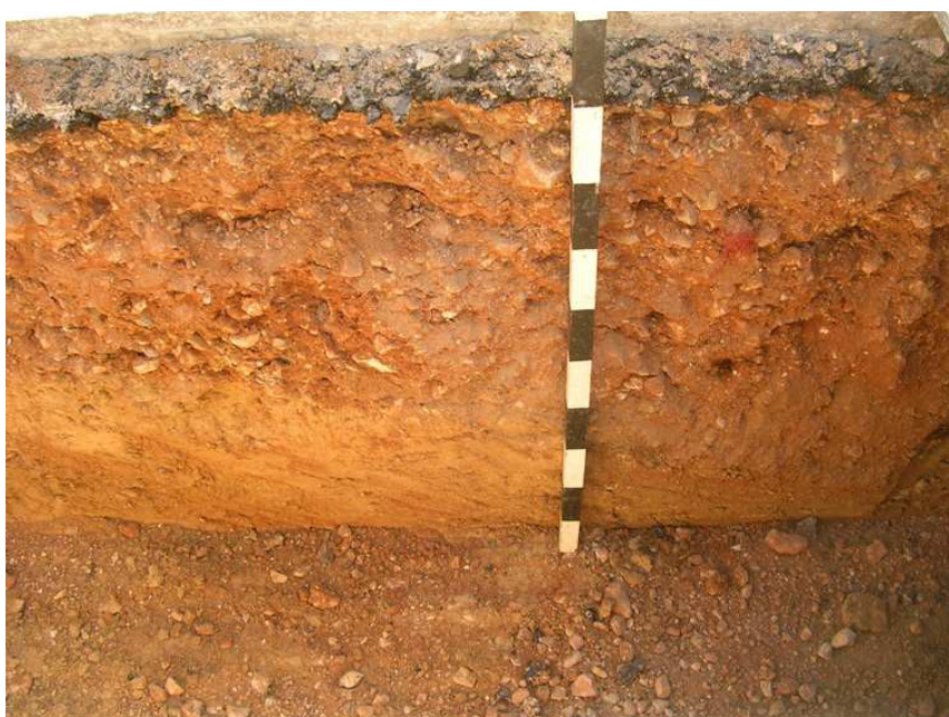
Tall estratigràfic 3