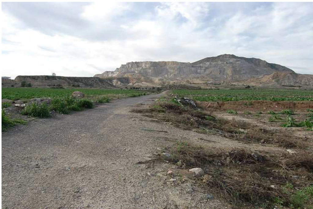
Vista general del proceso de prospección