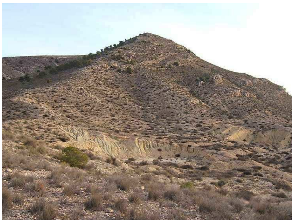
Vista general de la zona prospectada