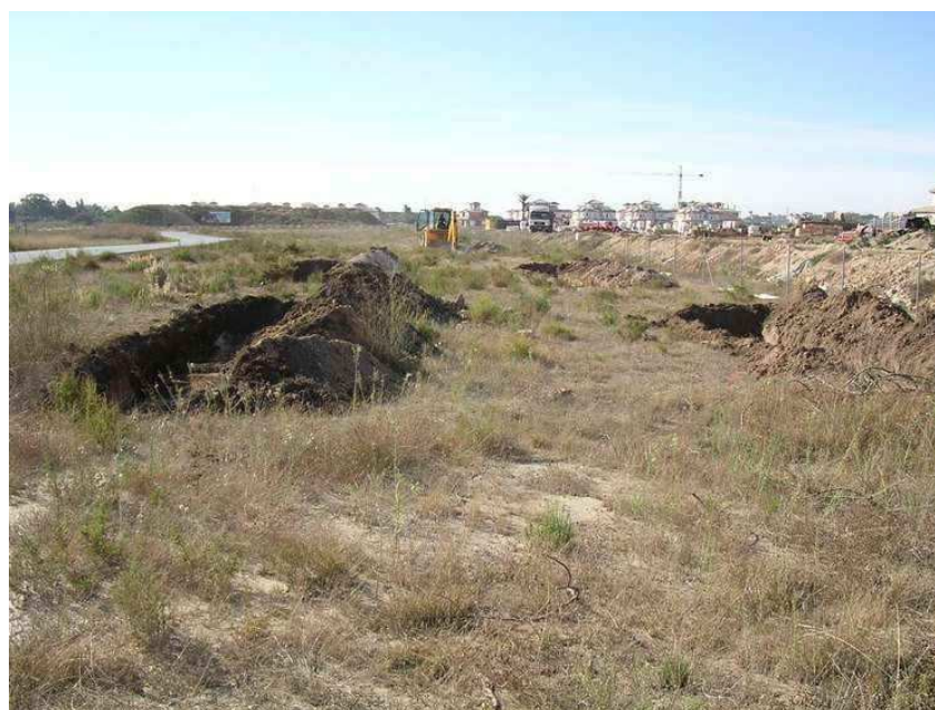
Vista parcial de los sondeos realizados