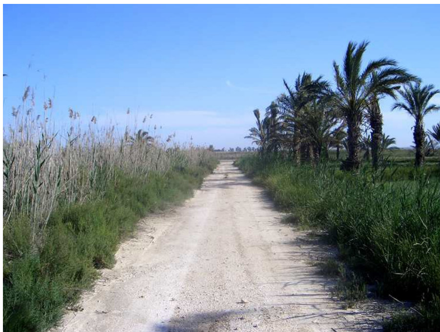
Vista de ramal secundario desde la carretera CV-851