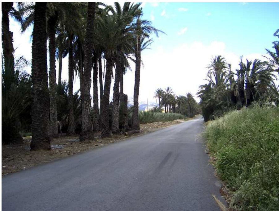
Camino de las elevaciones de Riegos de Levante o Canal Principal