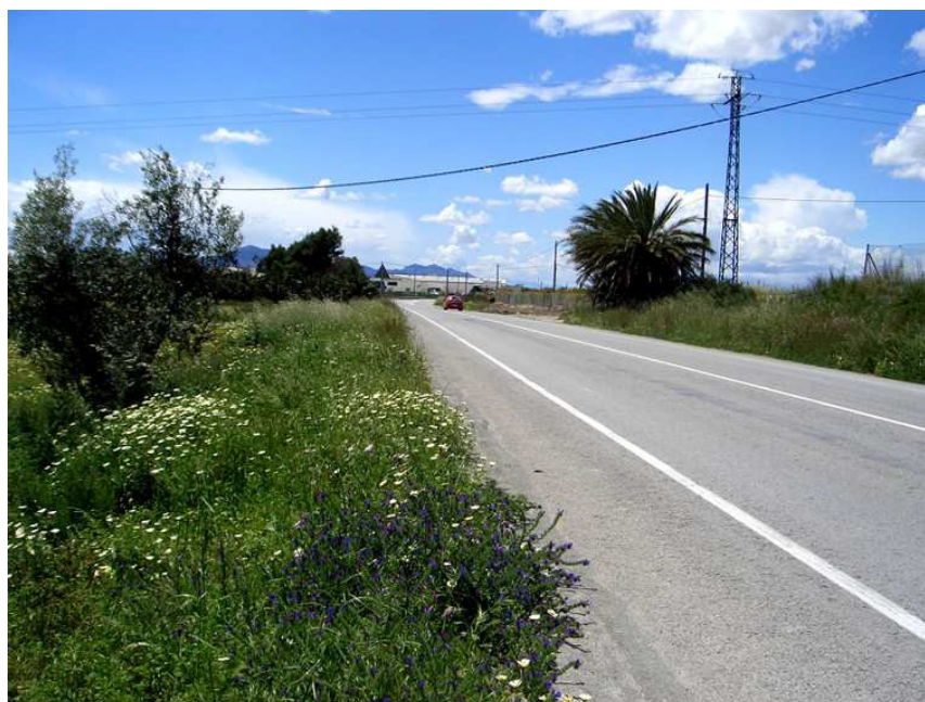
Tramo de la carretera Elche-Crevillente incluida en el Sector 1