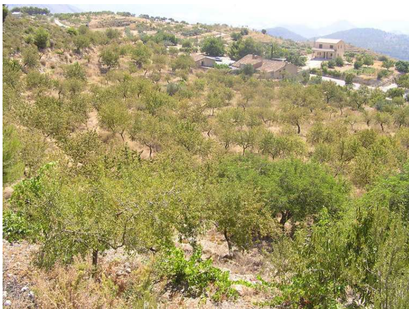
Vista general de la zona prospectada