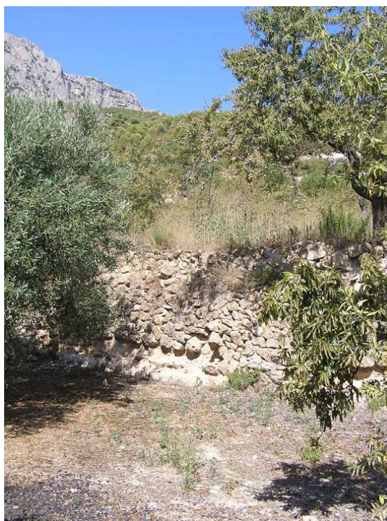
Bancal en la zona prospectada