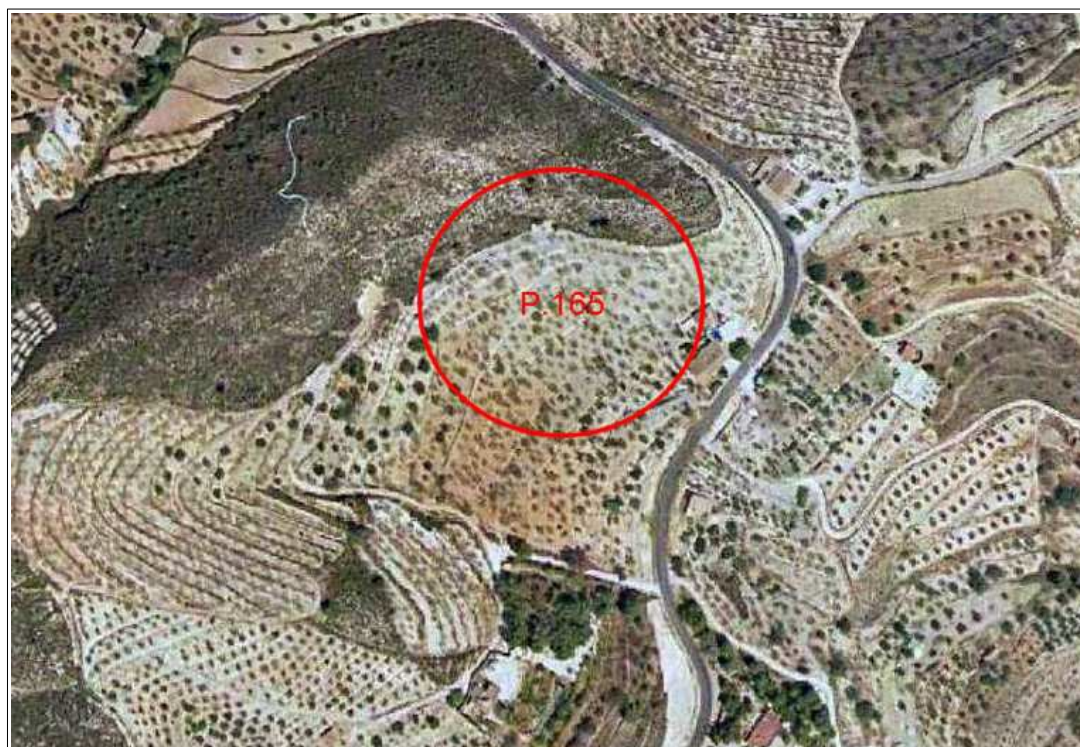
Vista aérea de situación