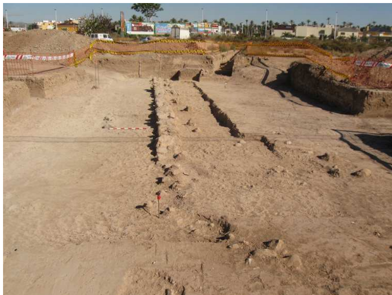
Vista general del área excavada y estructuras exhumadas