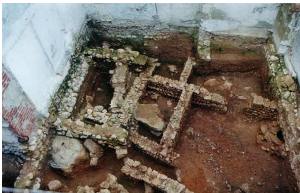
Vista general de l'excavació