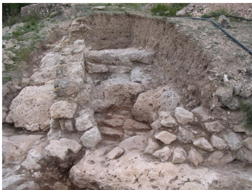
Sondeo realizado en el Sector III