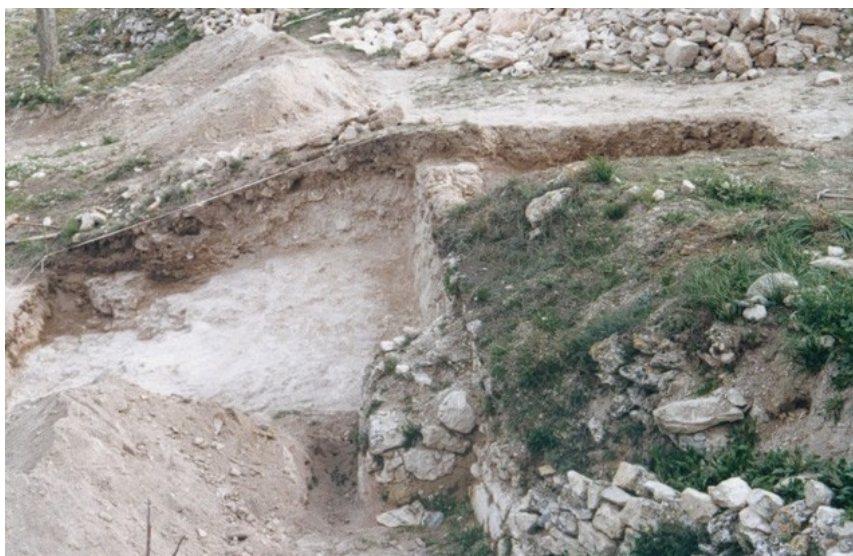
Aspecto del sondeo practicado en el Sector I