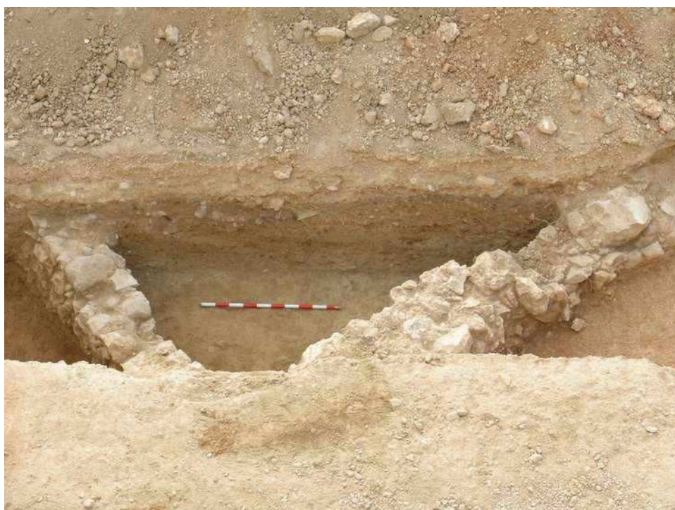
Estancia ibérica sondeo 1. Nivel más antiguo, siglo V a. C.