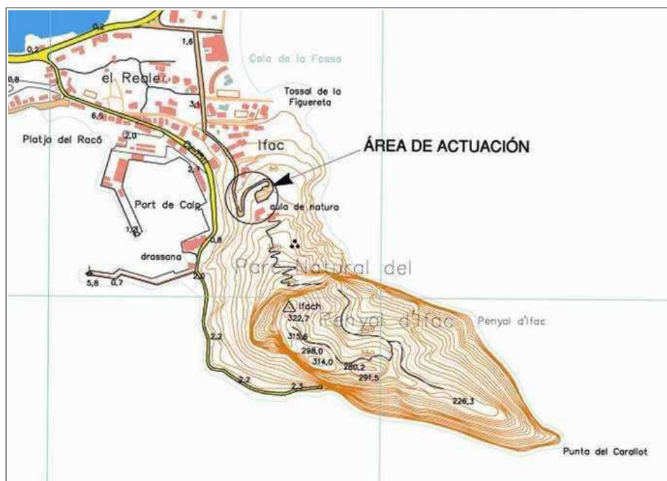
Situación área de actuación en el camino de acceso al Centro de Información

SPARKES, B. A. y TALCOTT, L. (1970): Black and Plain Pottery of the 6th, 5th and 4th Centuries B.C. , The Athenian Agora, XII, The American School of Classical Studies at Athens, Princeton.