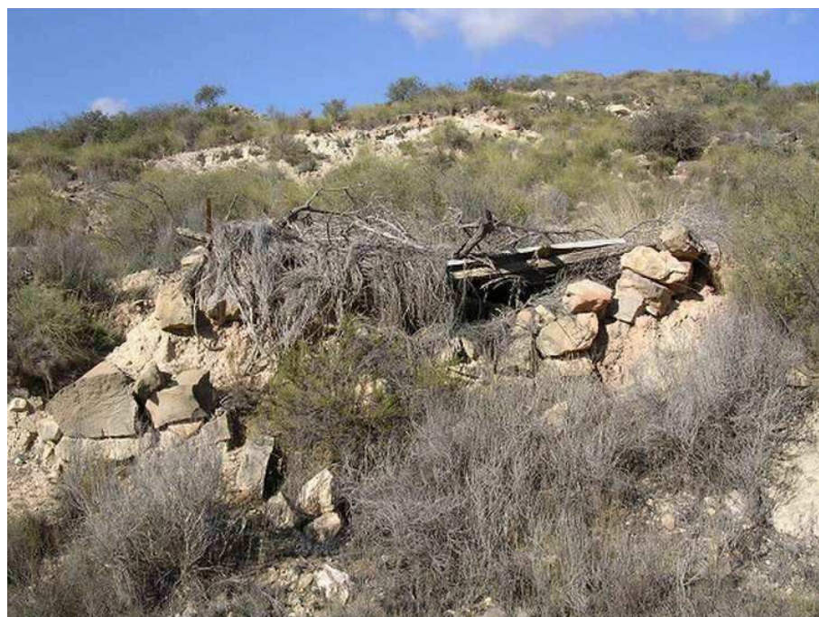
Puesto de cazadores