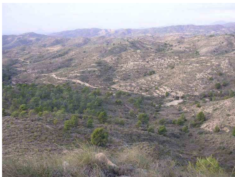
Vista general del área prospectada