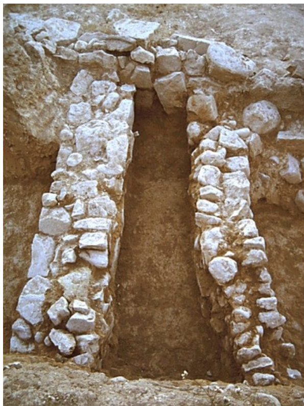
Vista de las estructuras documentadas