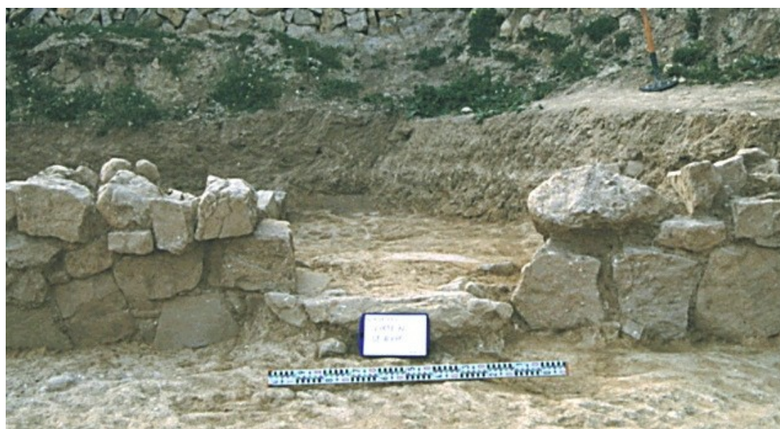
Detalle del umbral de la habitación