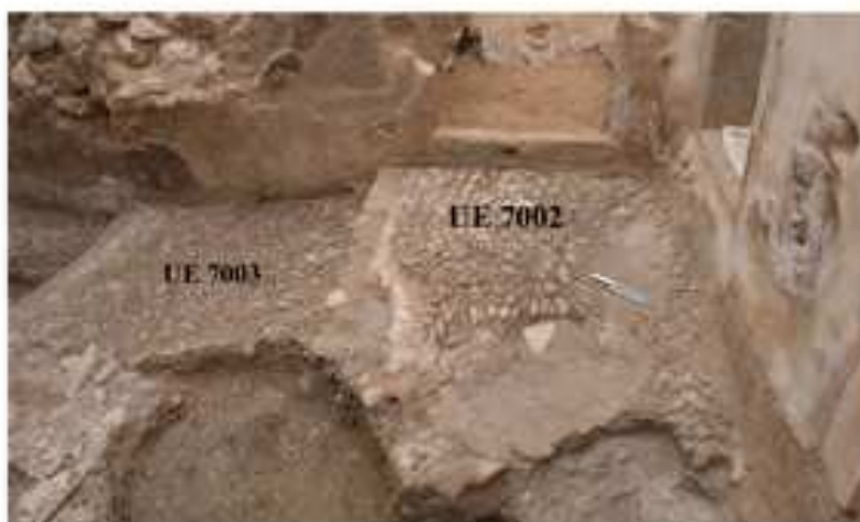
CE08/09: IE2-2,3: UE 7002-7003