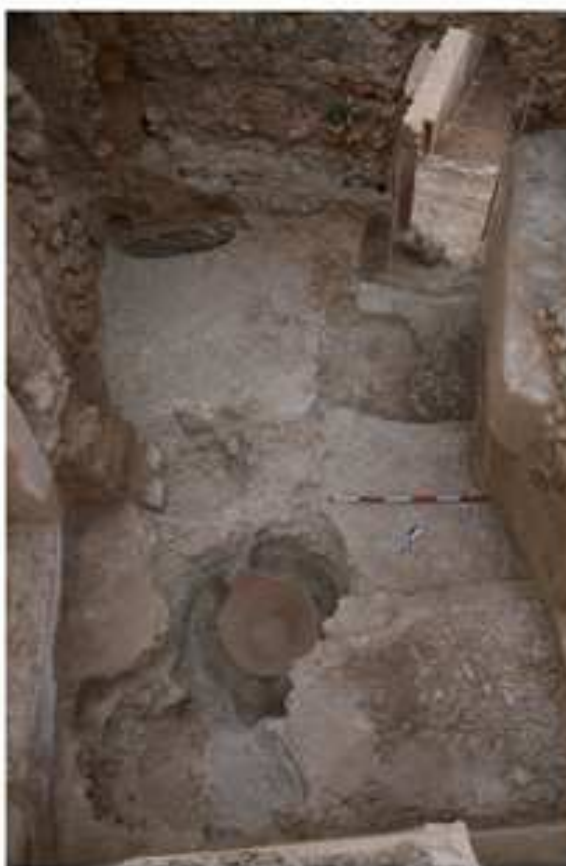
CE08/09: IE2-2,3. Fotos finales