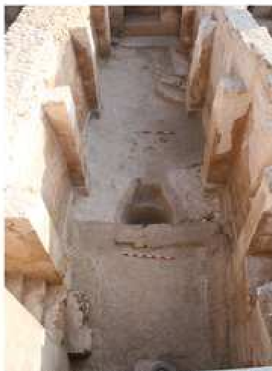
CE08/09: IE2-4. Fotos finales