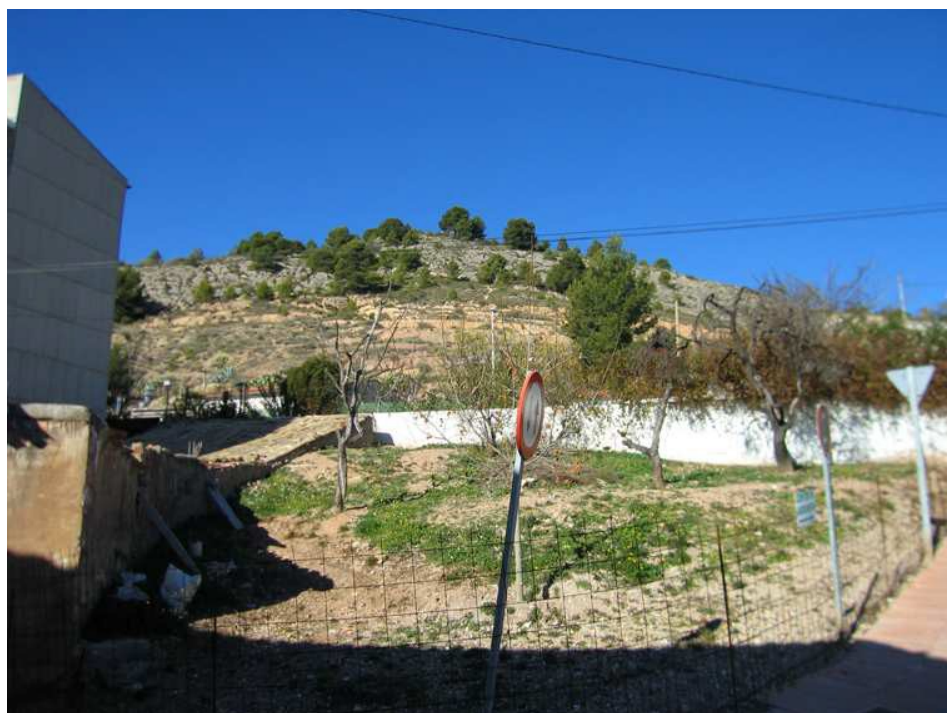
Vista del sector donde se construirá el depósito