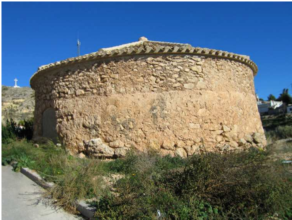
Pou de la Neu