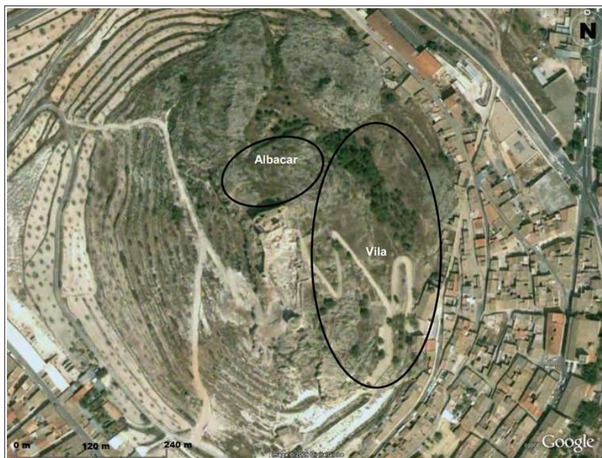
Vista general del área de actuación