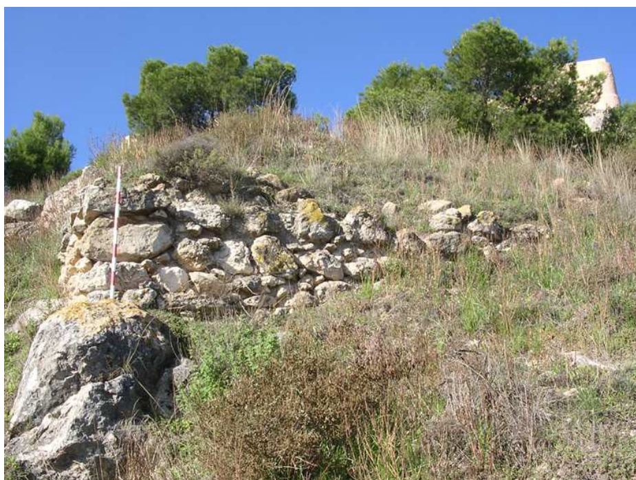
Lienzo de muralla con saliente en forma de cuña y restos de una posible torre