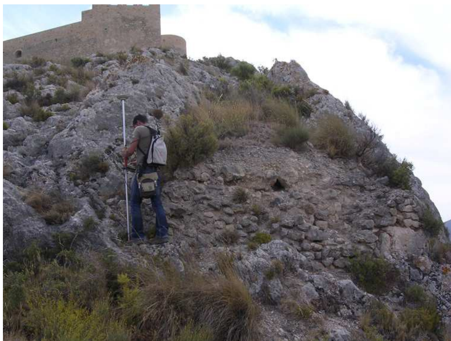
Toma de datos con el GPS Leica